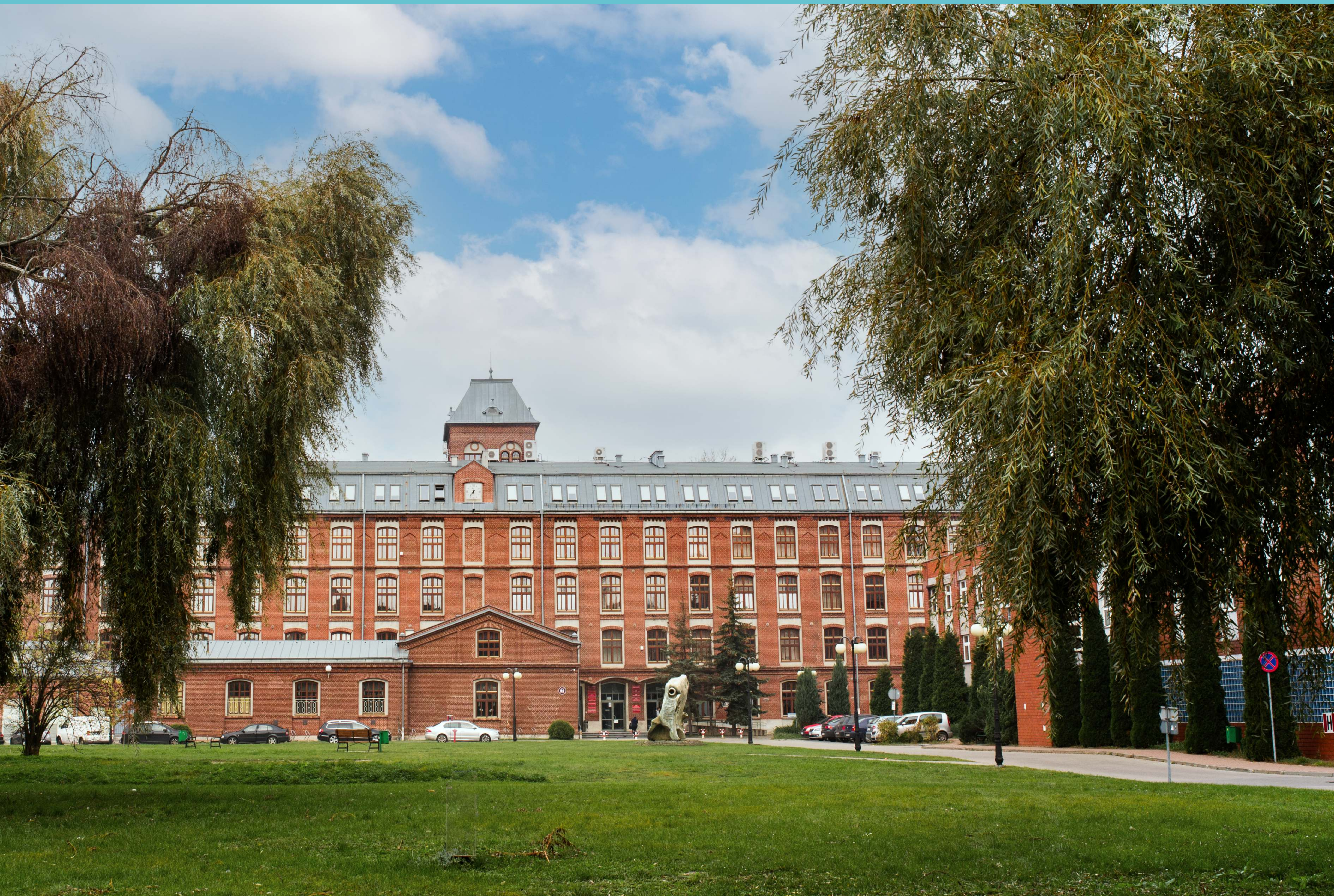
Kampus Politechniki Łódzkiej, część południowa. Budynek Trzech Wydziałów, 2023 rok