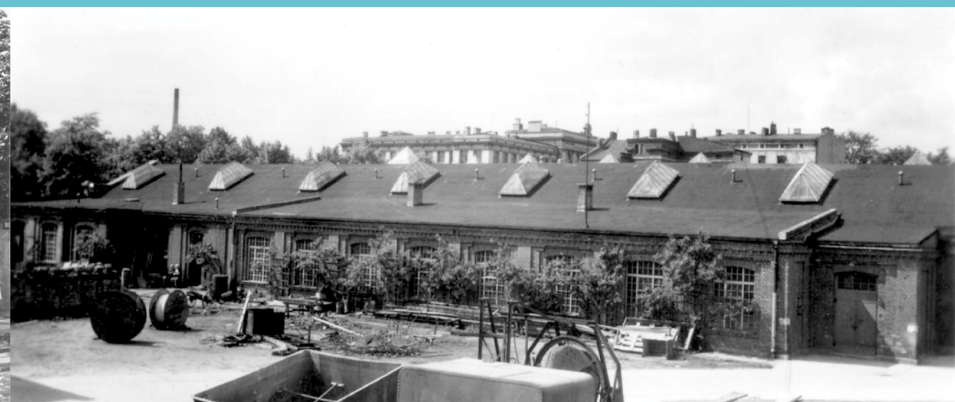
Teren Politechniki Łódzkiej. Pawilon Wykończalnictwa Wydziału Włókienniczego, obecnie Technologii Materiałowych i Wzornictwa Tekstyliów, 1948 rok