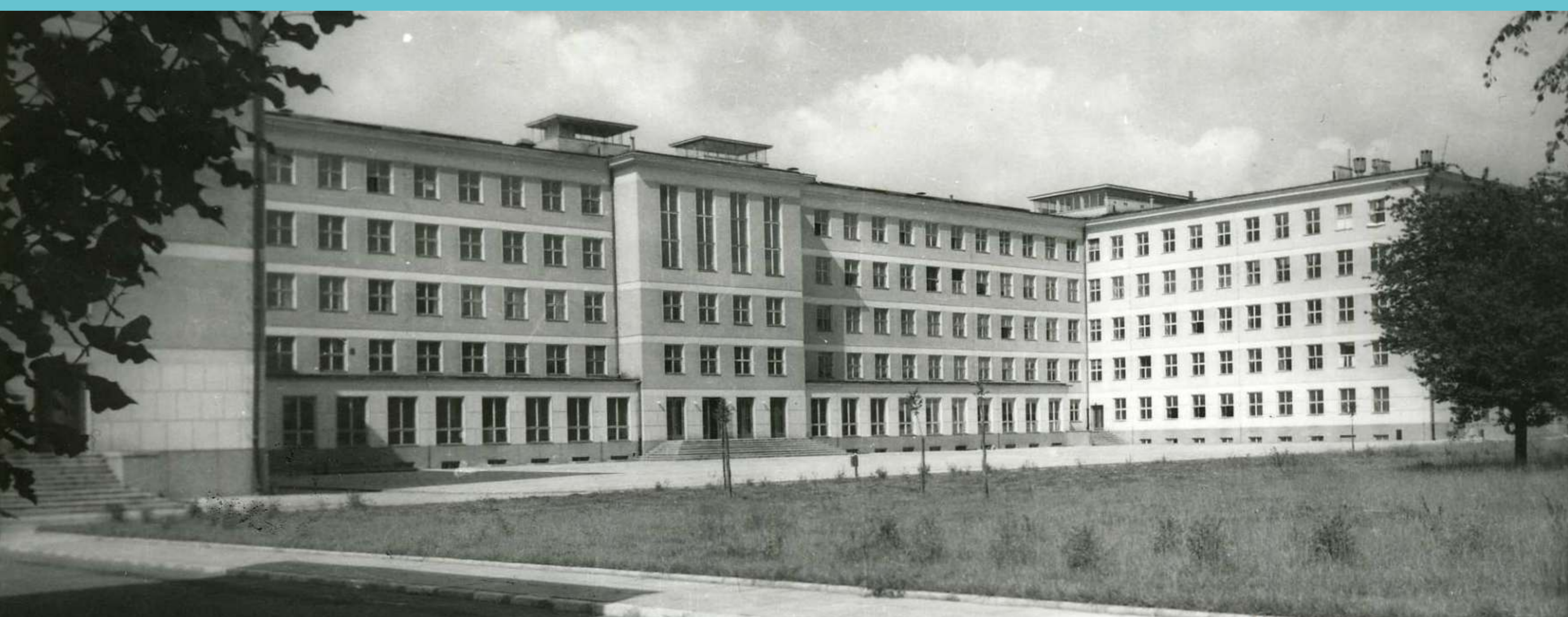
Teren Politechniki Łódzkiej. Widok od strony dziedzińca na budynek Wydziału Włókienniczego obecnie Technologii Materiałowych i Wzornictwa Tekstyliów