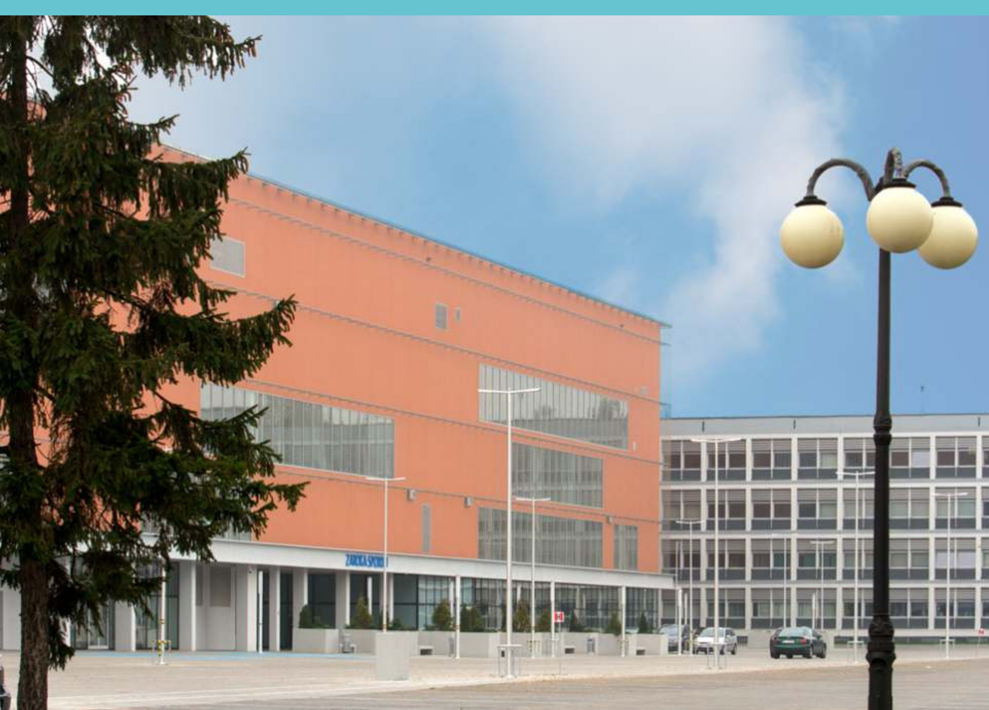
Kampus Politechniki Łódzkiej, część południowa. Zatoka Sportu, 2022 rok