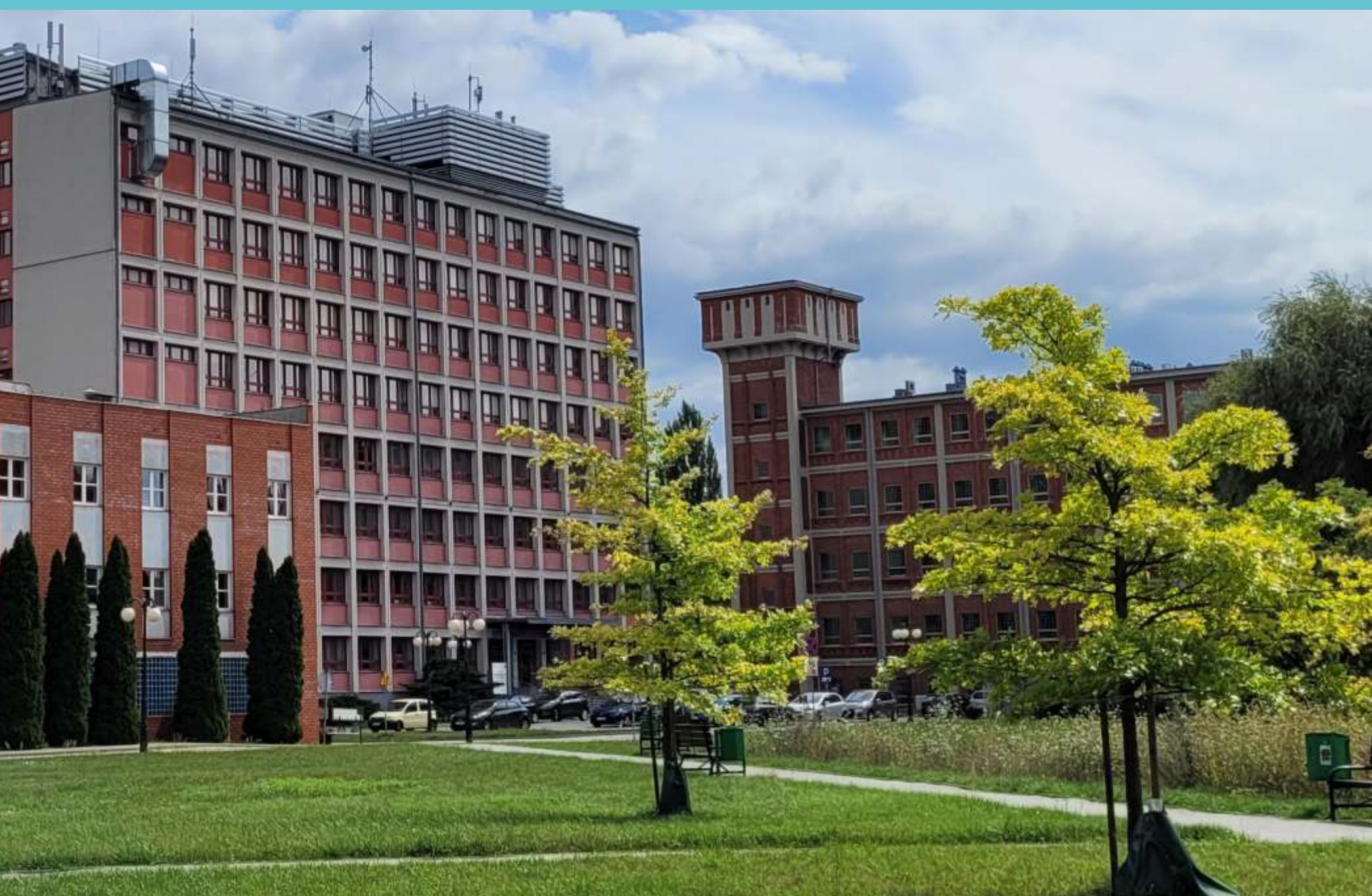
Kampus Politechniki Łódzkiej, część południowa, 2023 rok