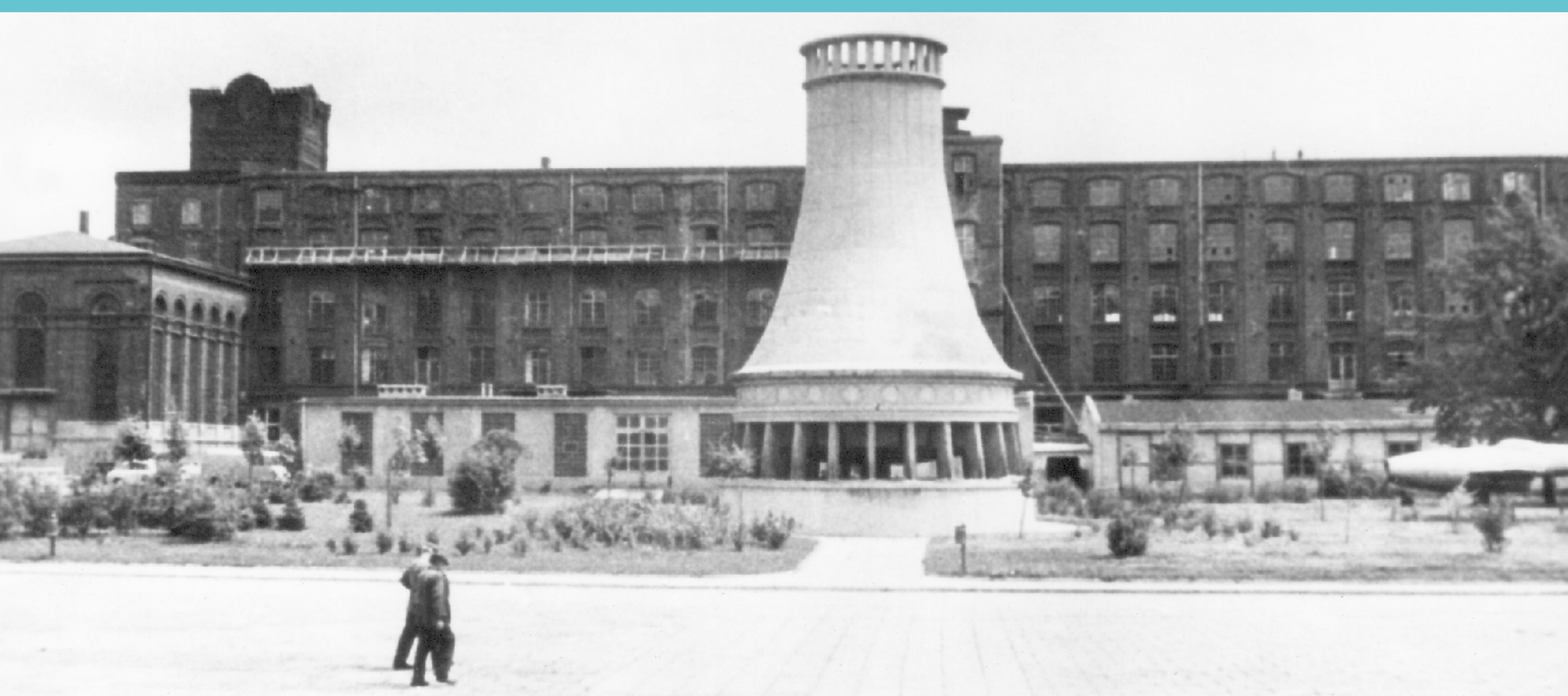
Teren Politechniki Łódzkiej. Widok na wieżę chłodniczą i Gundlachówkę od strony dziedzińca. Lata 50. XX wieku