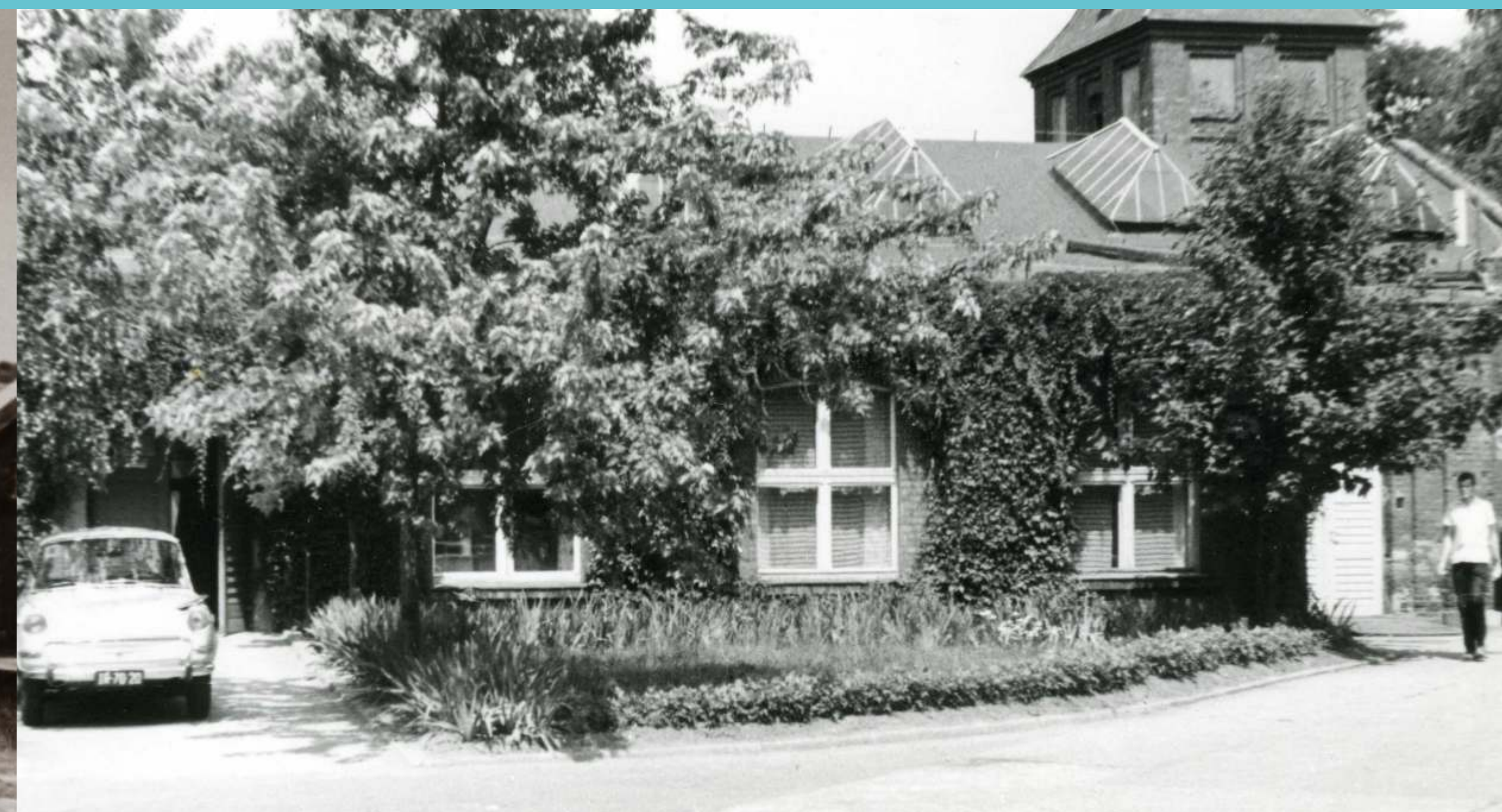
Budynek Wydziału Włókienniczego rozebrany w latach 2001-2003. Do dziś zachowała się tylko wieża