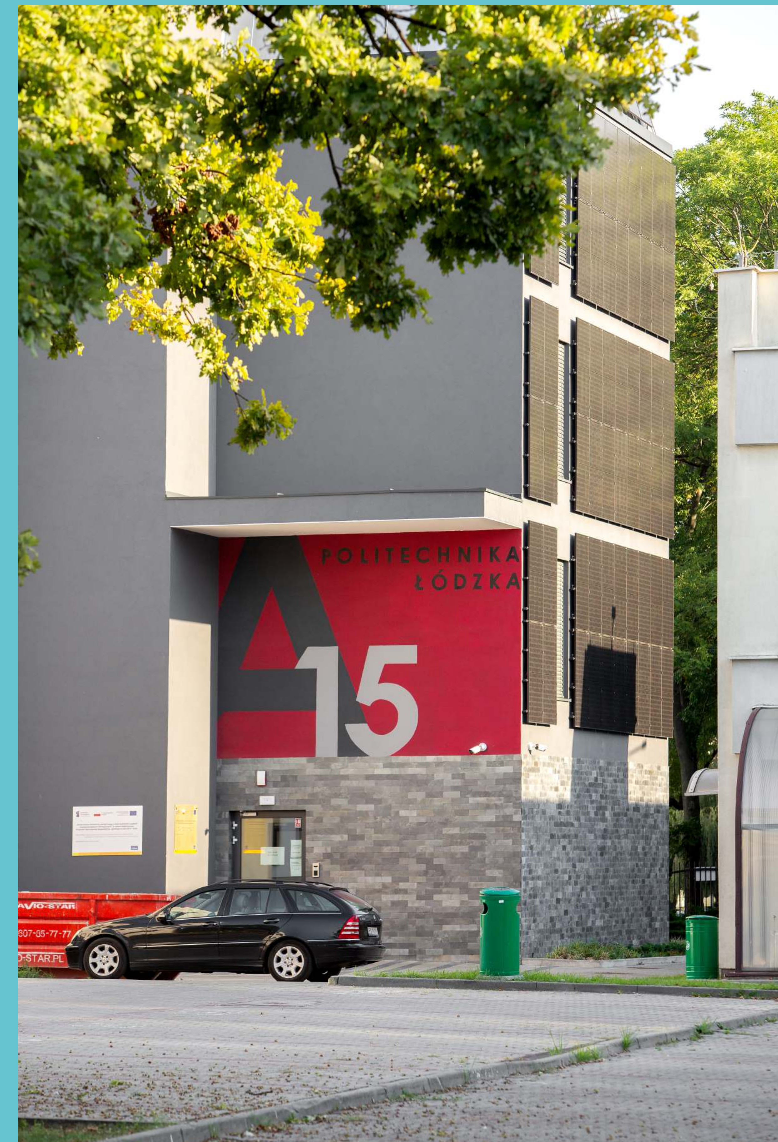
Kampus Politechniki Łódzkiej, część północna, 2023 rok