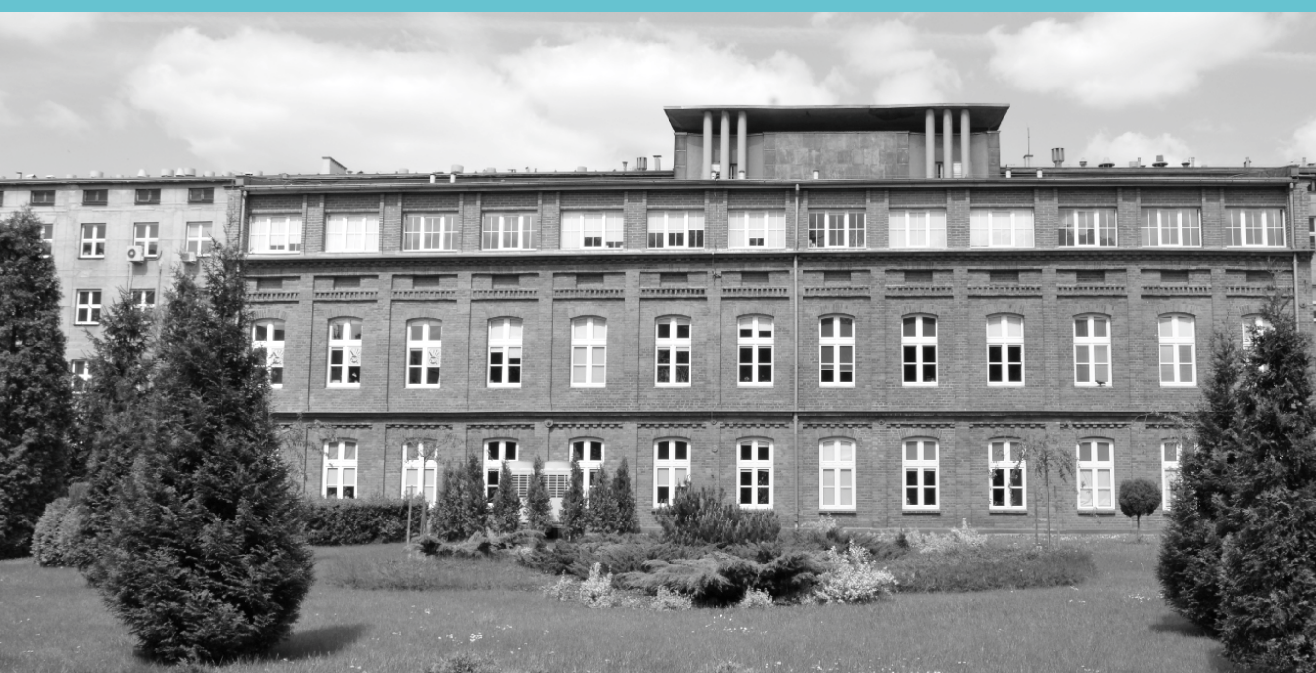
Budynek administracji kanclerskiej, w tle budynek Wydziału Chemicznego. Początek XXI wieku