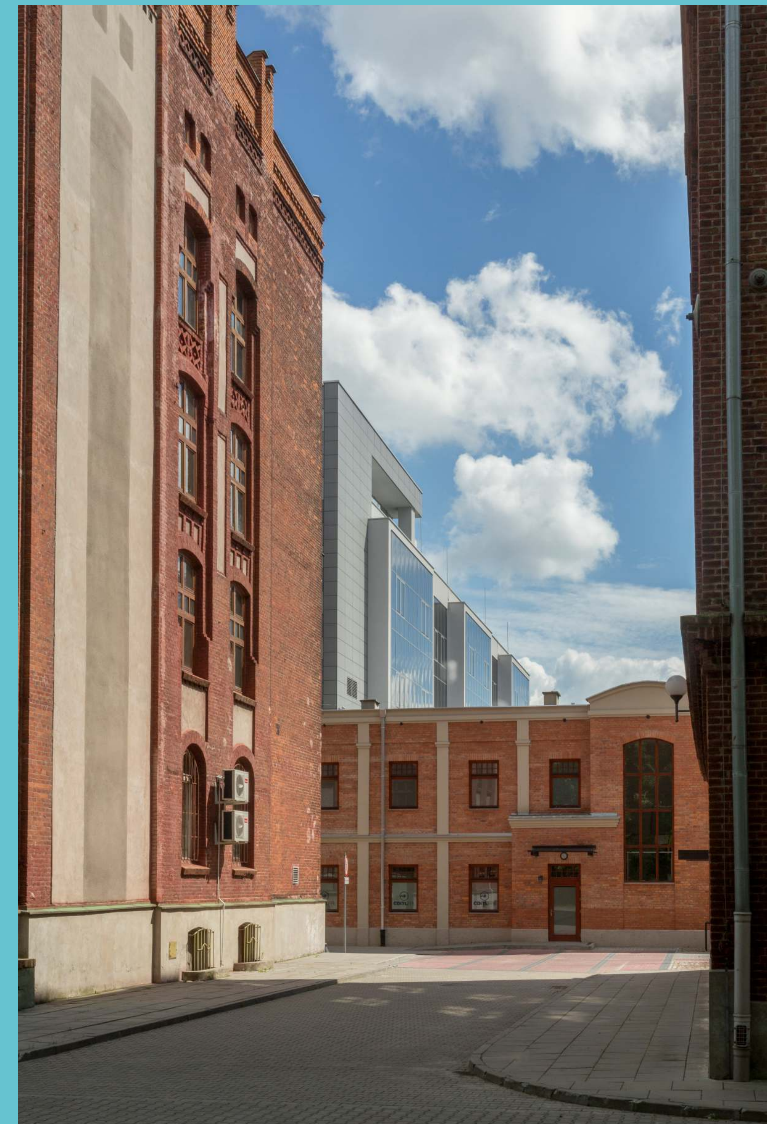
Kampus Politechniki Łódzkiej, część południowa, 2019 rok