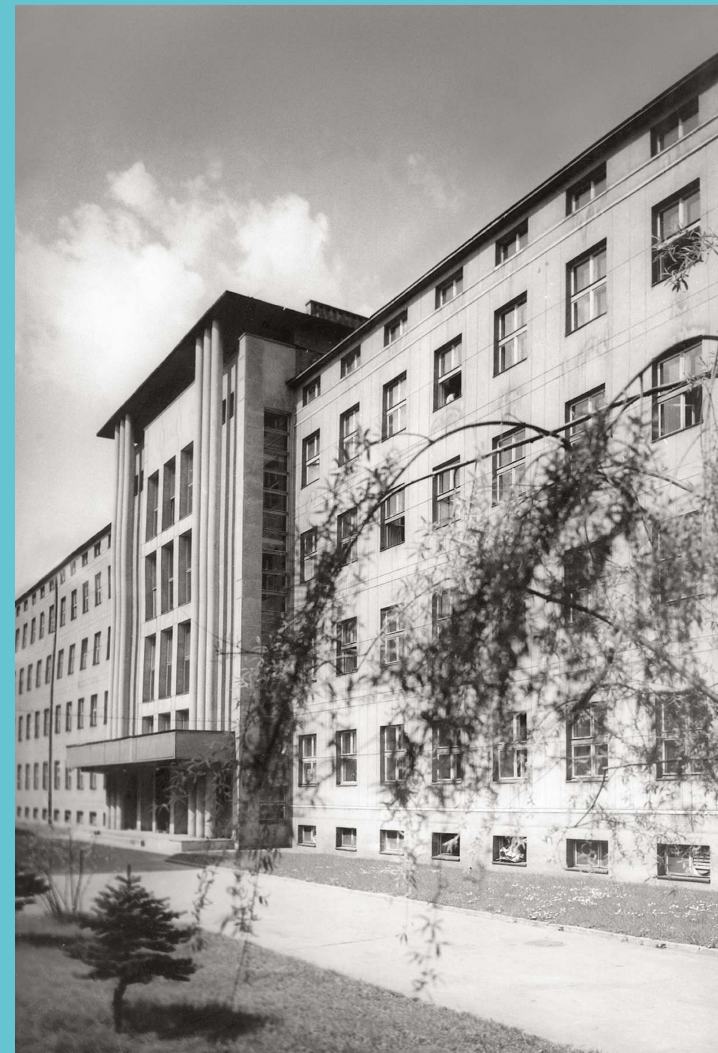
Budynek Wydziału Chemicznego. Lata 50. XX wieku