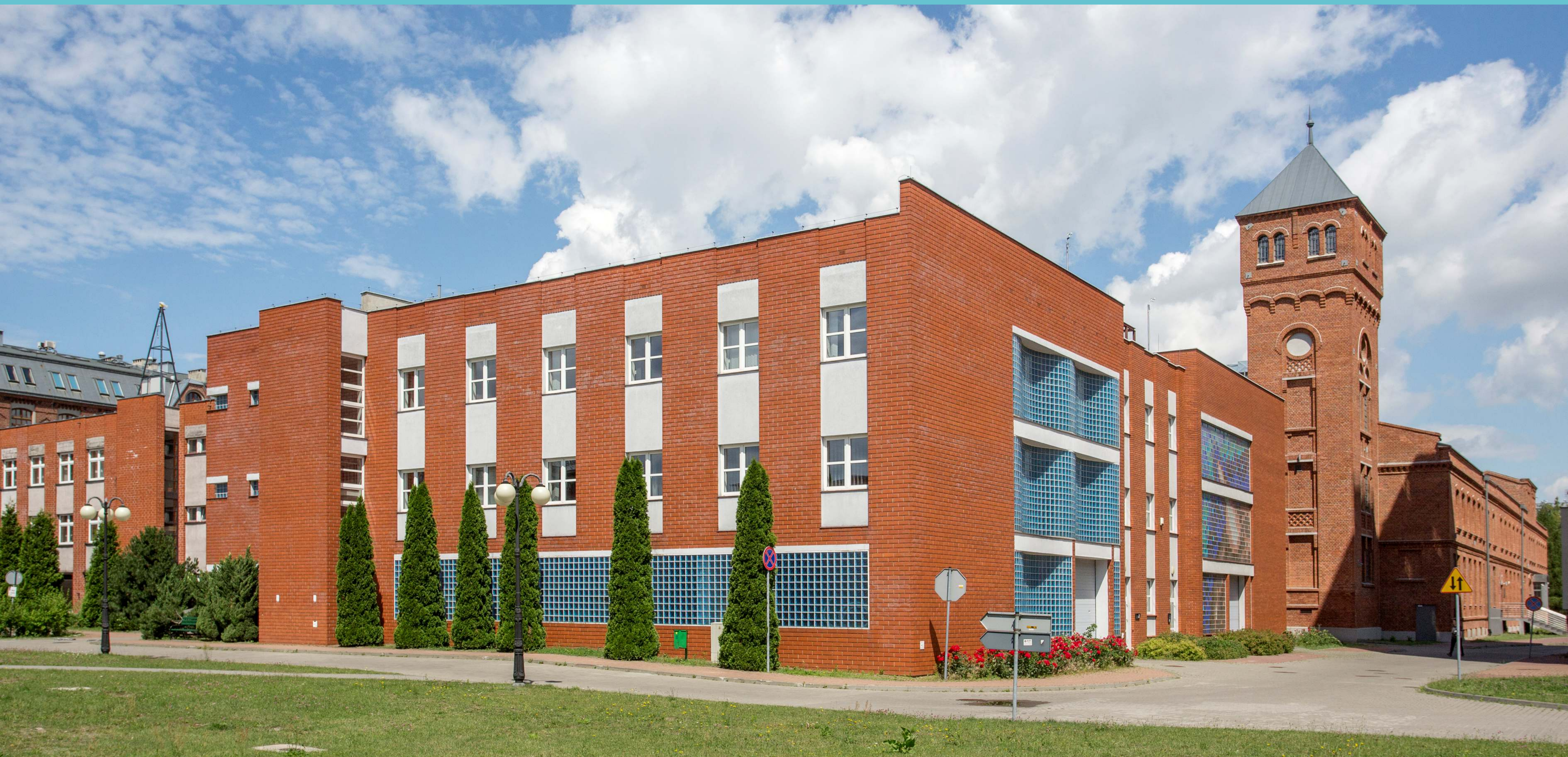
Kampus Politechniki Łódzkiej, część południowa. Instytut Maszyn Przepływowych Wydziału Mechanicznego. Druga dekada XXI wieku