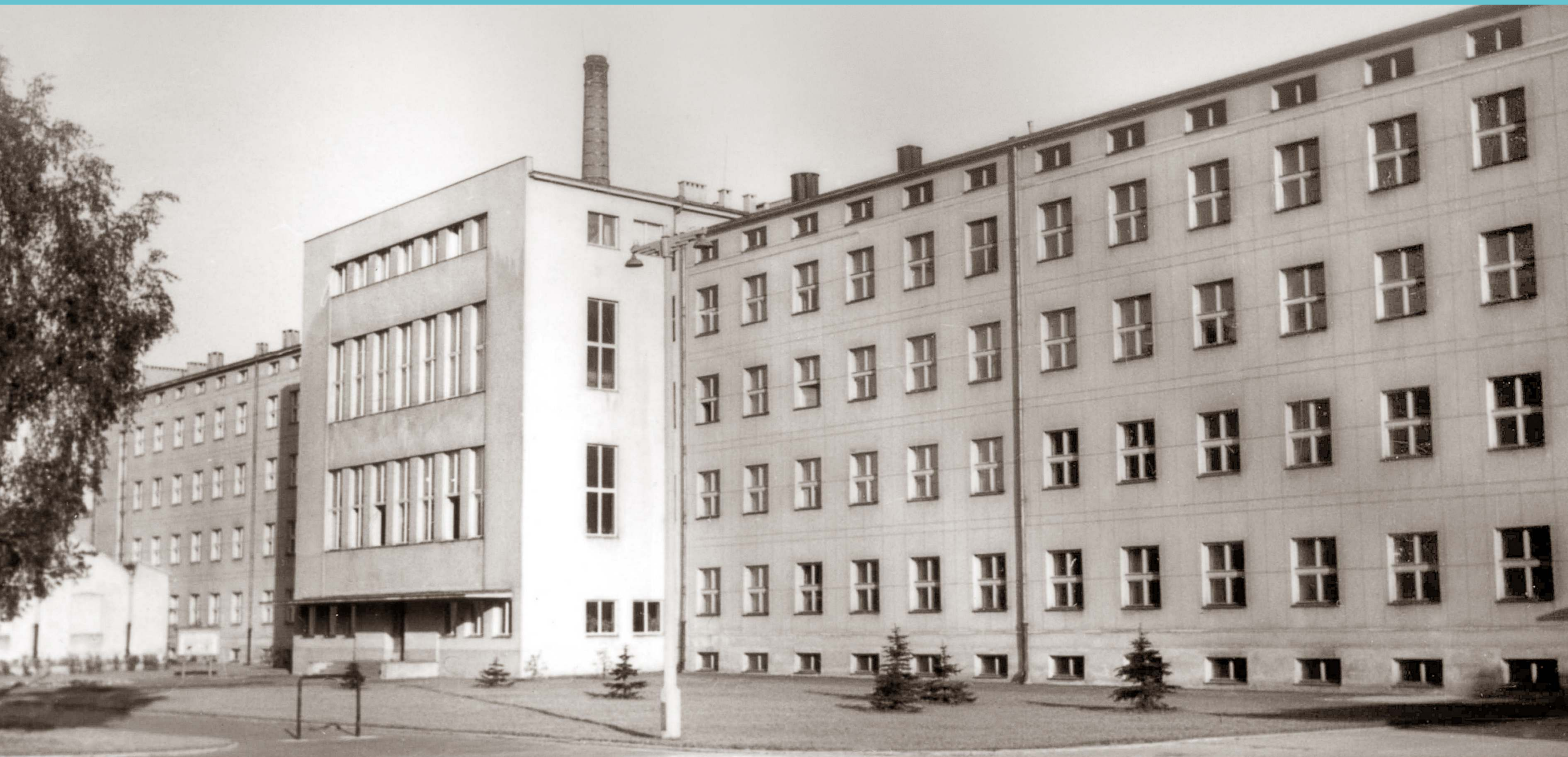
Kampus Politechniki Łódzkiej, część północna. Budynek Wydziału Chemicznego od strony północnej. Początek lat 50. XX wieku