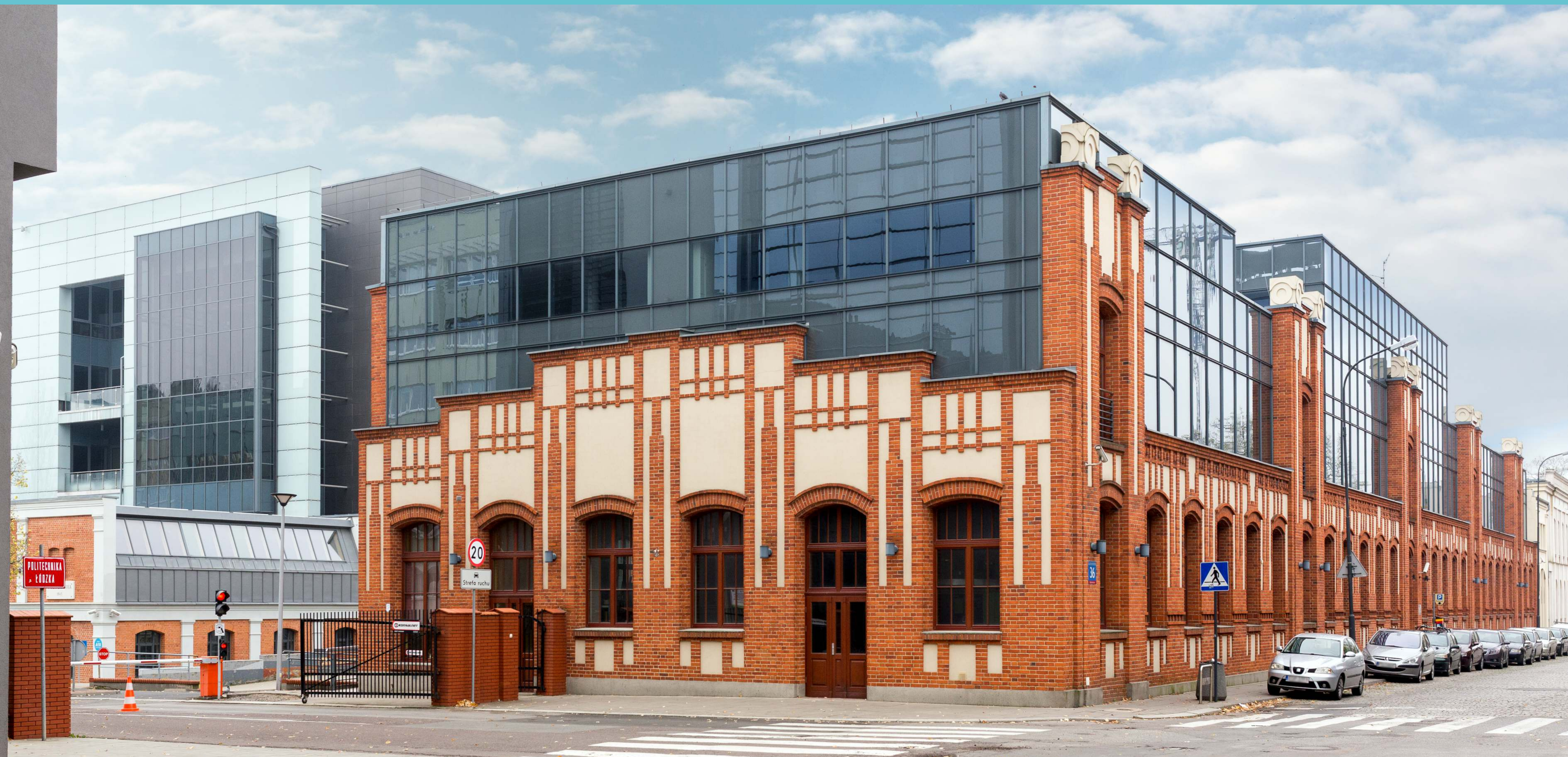
Budynek Centrum Kształcenia Międzynarodowego IFE Politechniki Łódzkiej. W głębi po lewej stronie widać budynek Wydziału Mechanicznego Fabryka Inżynierów , 2021 rok