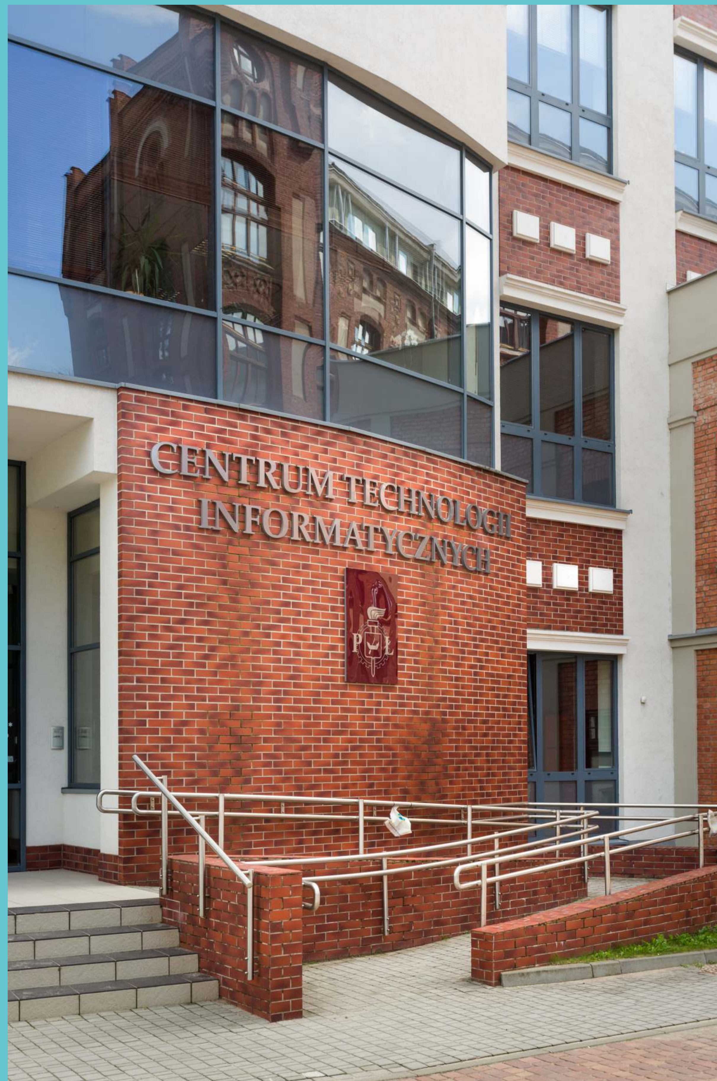
Kampus Politechniki Łódzkiej, część południowa, 2020 rok