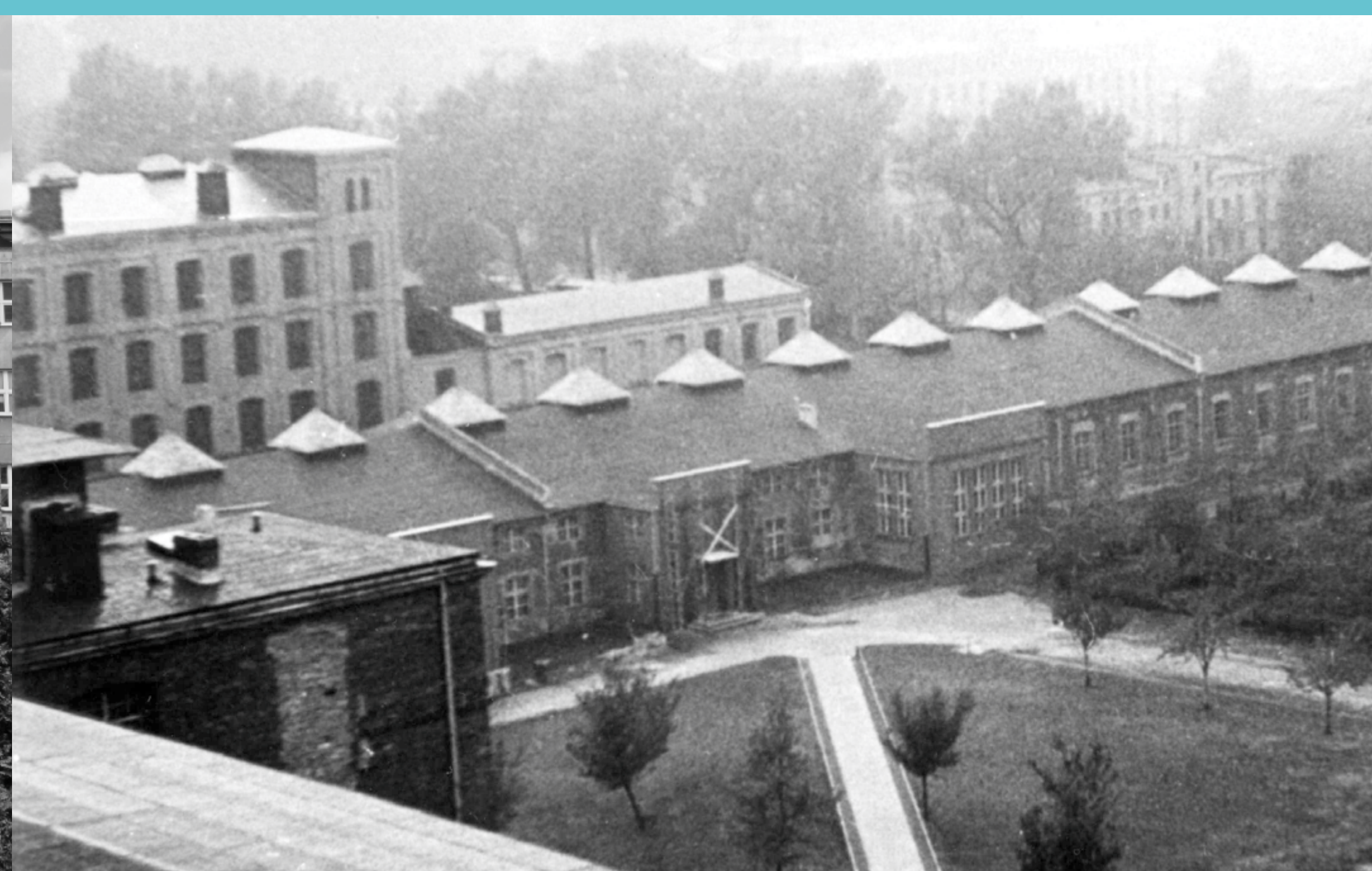
Teren Politechniki Łódzkiej. Koniec lat 40. XX wieku