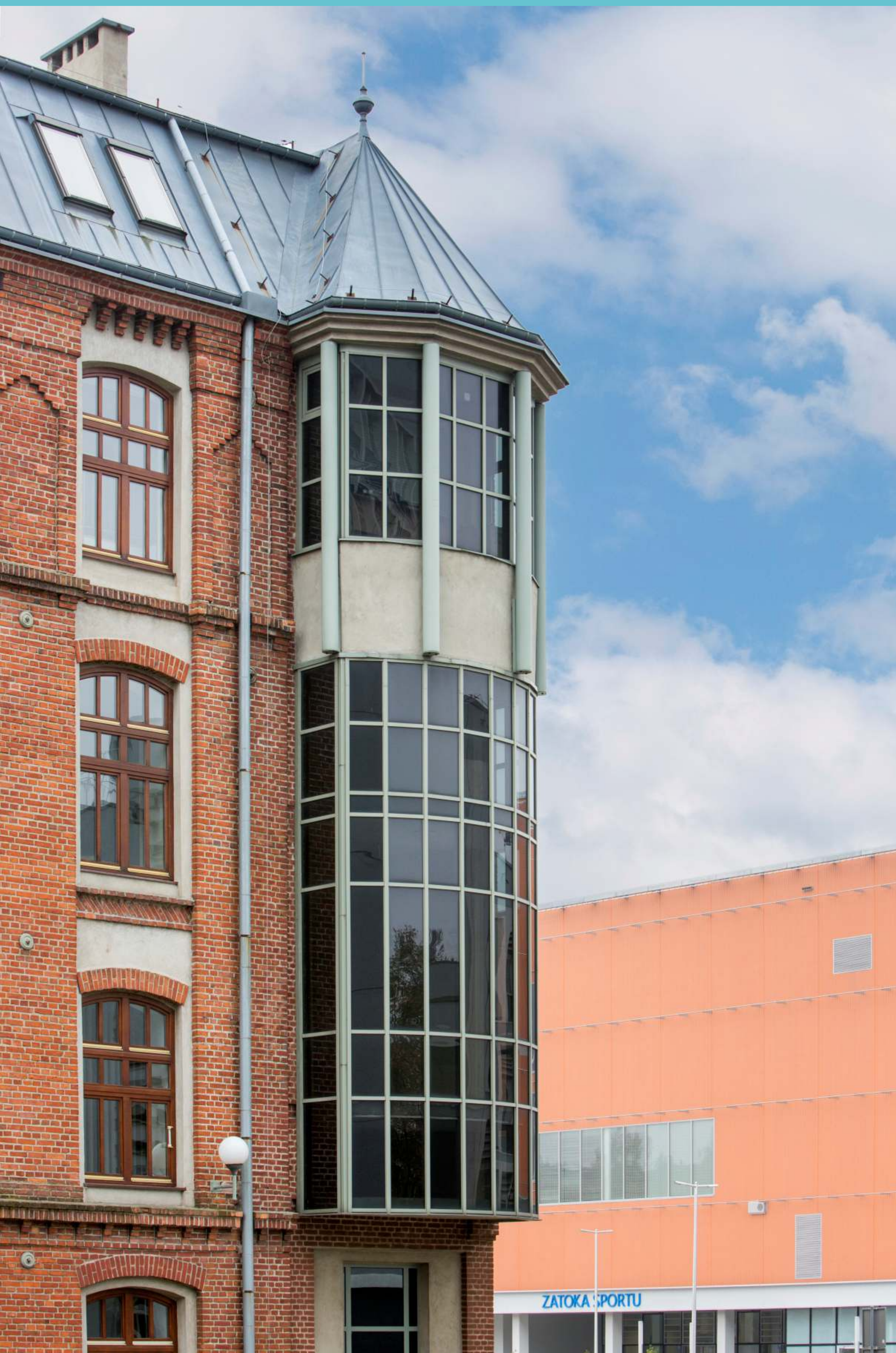
Kampus Politechniki Łódzkiej, część południowa, 2021 rok