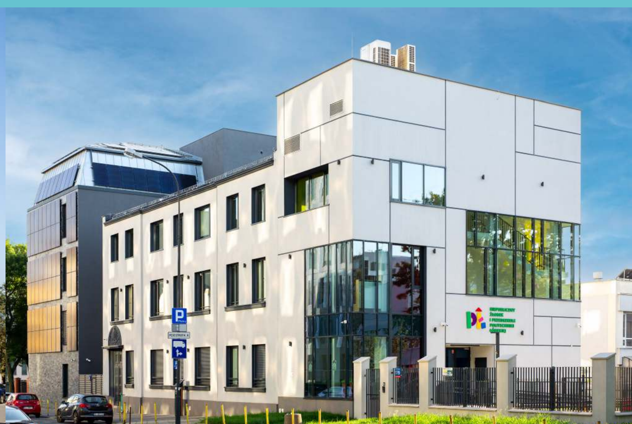
Żłobek i przedszkole Politechniki Łódzkiej, północna część kampusu, 2023 rok