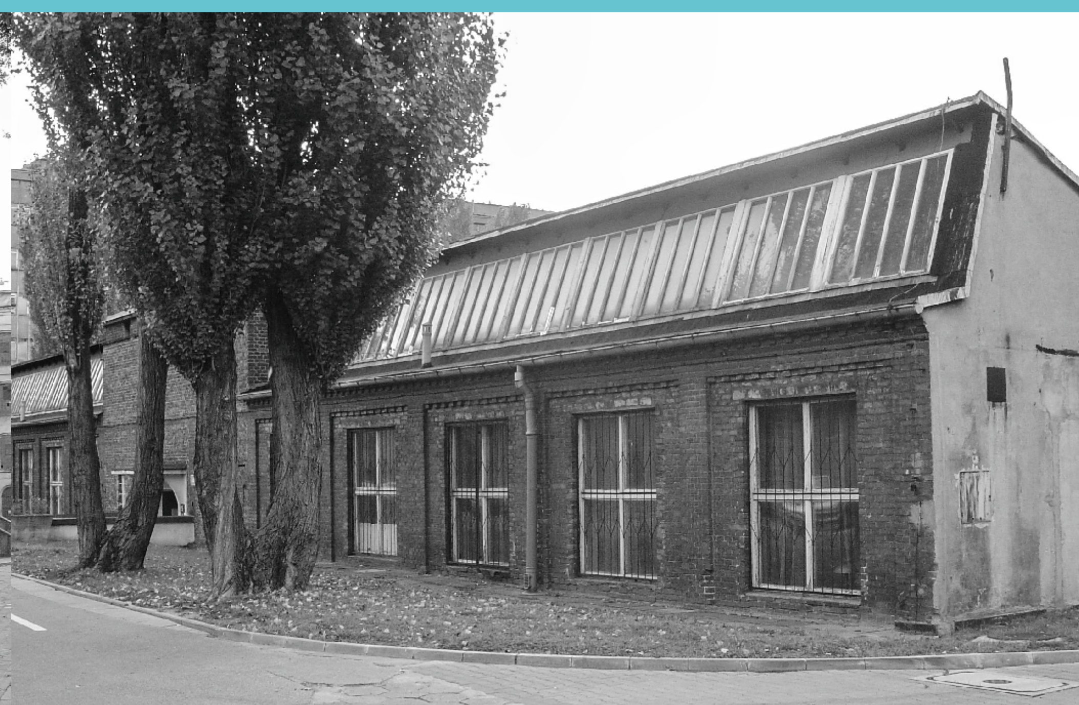
Budynek szedowy Wydziału Mechanicznego. Obecnie znajduje się w tym miejscu budynek Fabryka Inżynierów . Lata 90. XX wieku