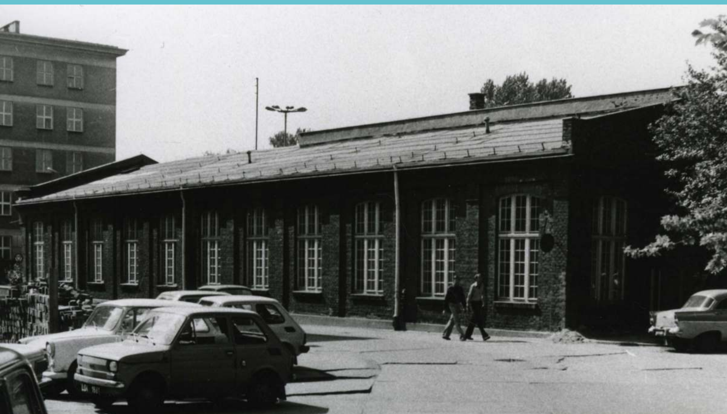
Teren Politechniki Łódzkiej. Budynek Wydziału Mechanicznego. Lata 80. XX wieku