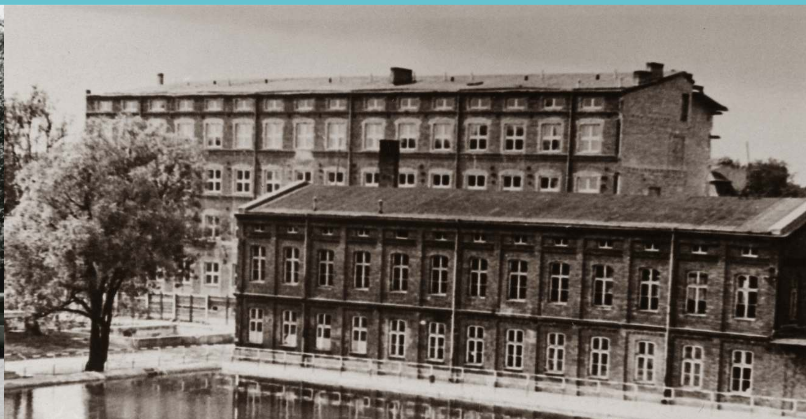
Budynek stołówki studenckiej, a później siedziba działu technicznego. W głębi budynek Wydziału Chemicznego w trakcie rewitalizacji. Lata 40. XX wieku