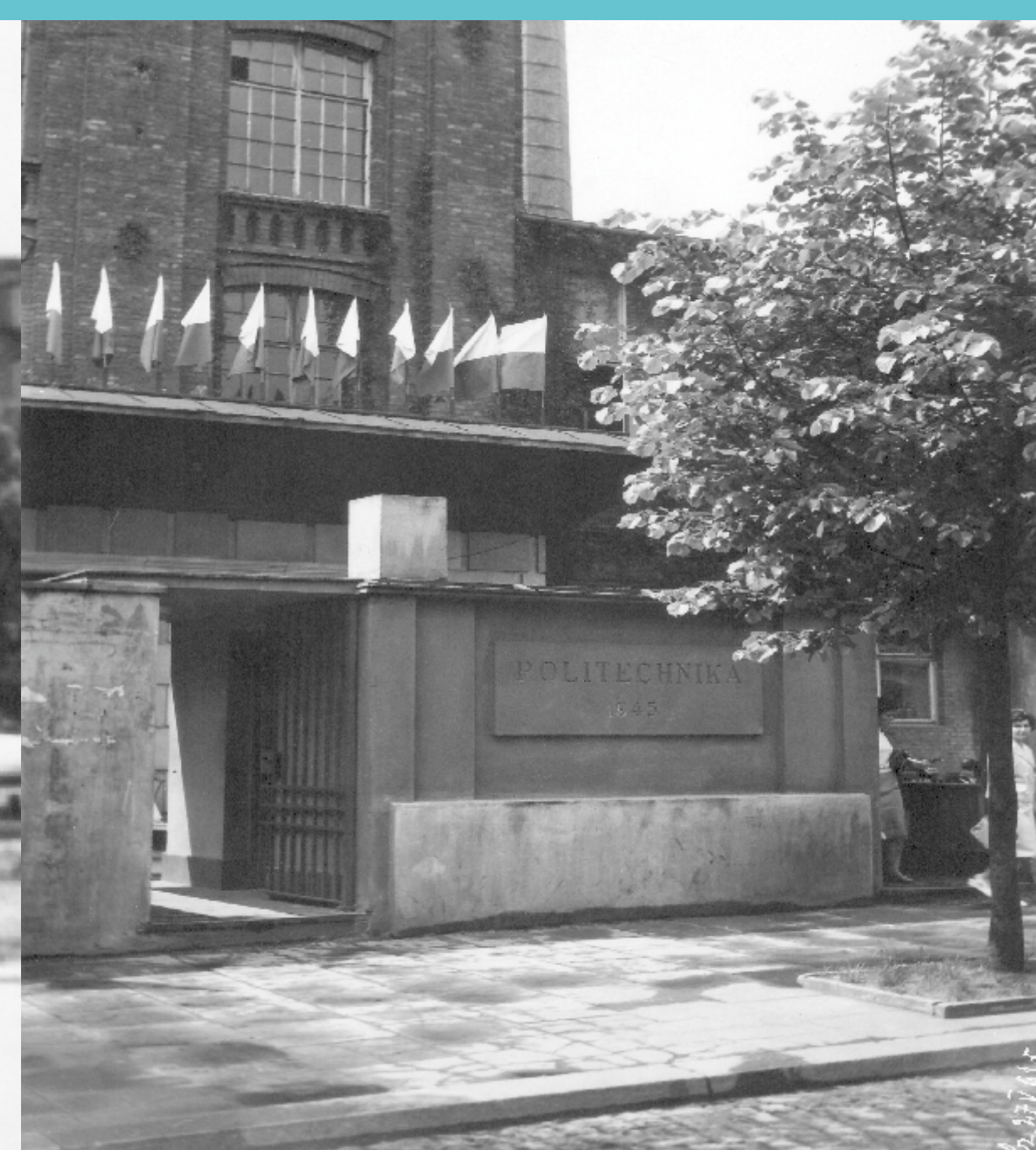
Wejście główne na teren Politechniki Łódzkiej. Lata 60. XX wieku