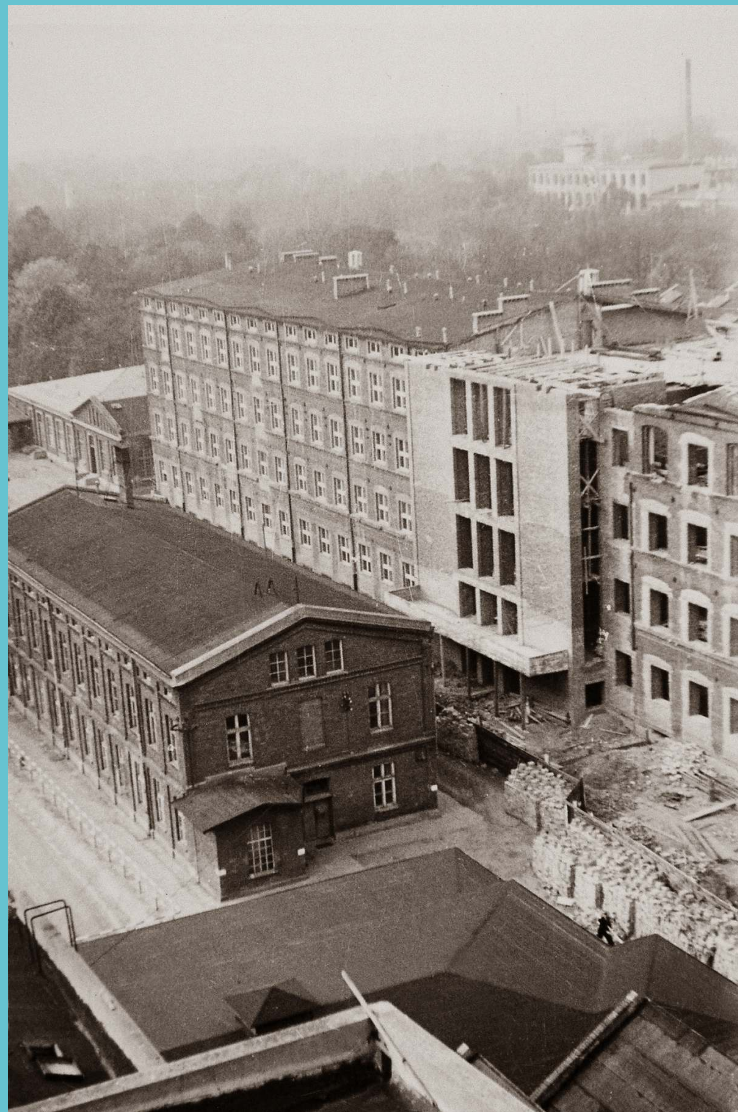
Teren Politechniki Łódzkiej. Lata 40. XX wieku