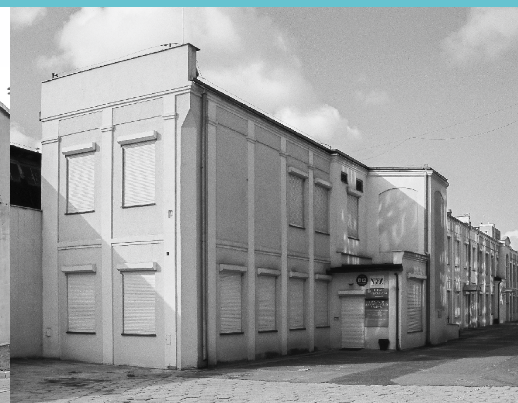
Kampus Politechniki Łódzkiej, część południowa