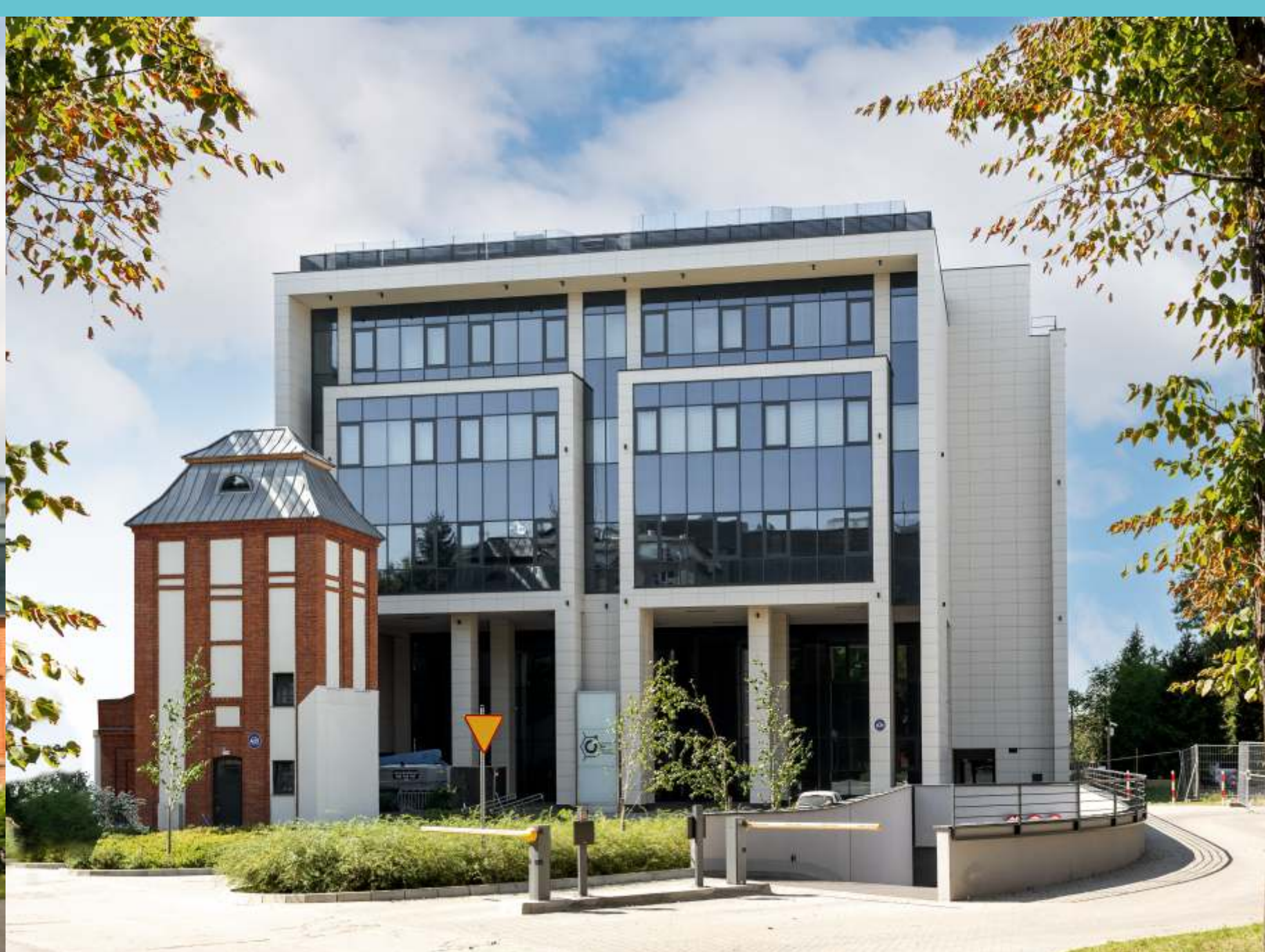
Budynek Wydziału Chemicznego Alchemium - magia chemii jutra , 2022 rok