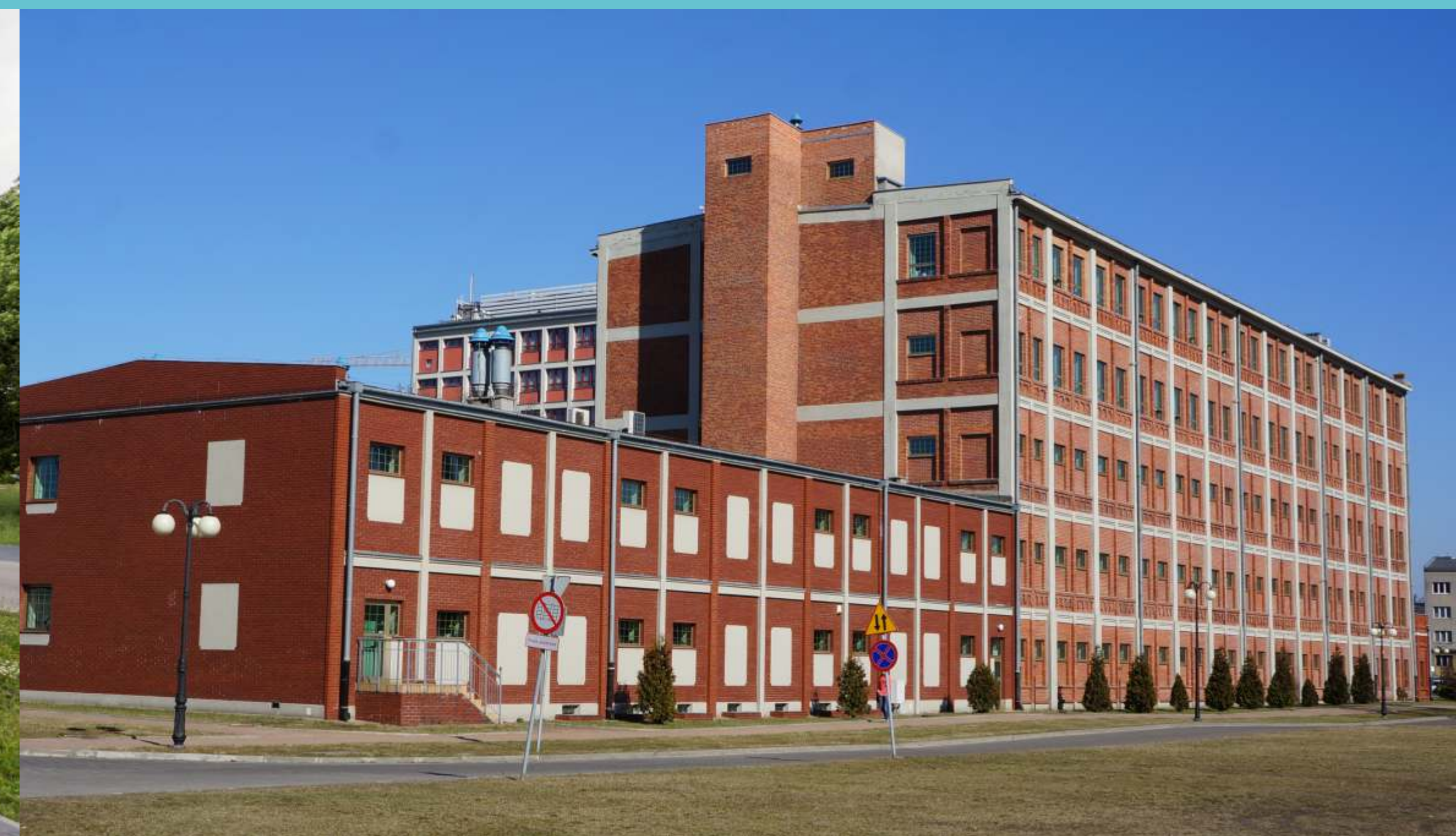
Kampus Politechniki Łódzkiej, część południowa. Budynek Biblioteki. Początek XXI wieku