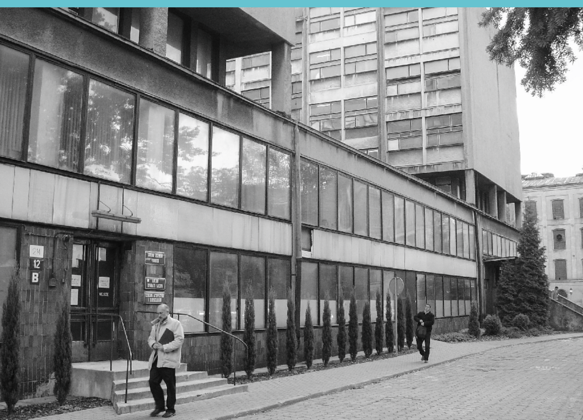
Budynek Wydziału Mechanicznego. Lata 90. XX wieku