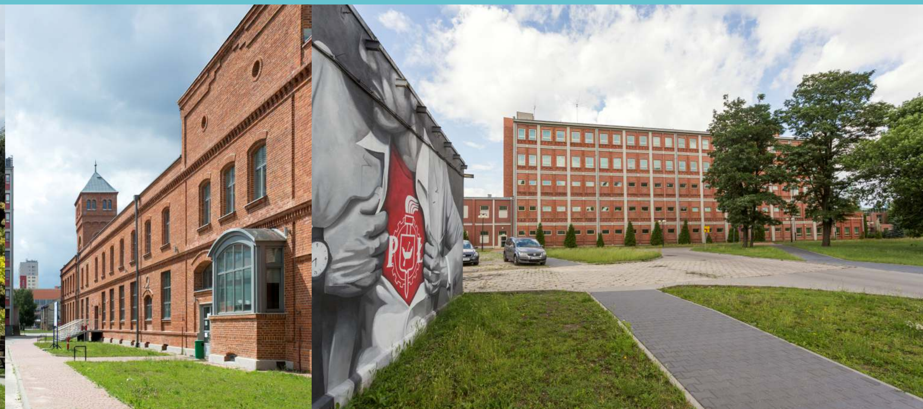
Kampus PŁ, część południowa, 2017 rok