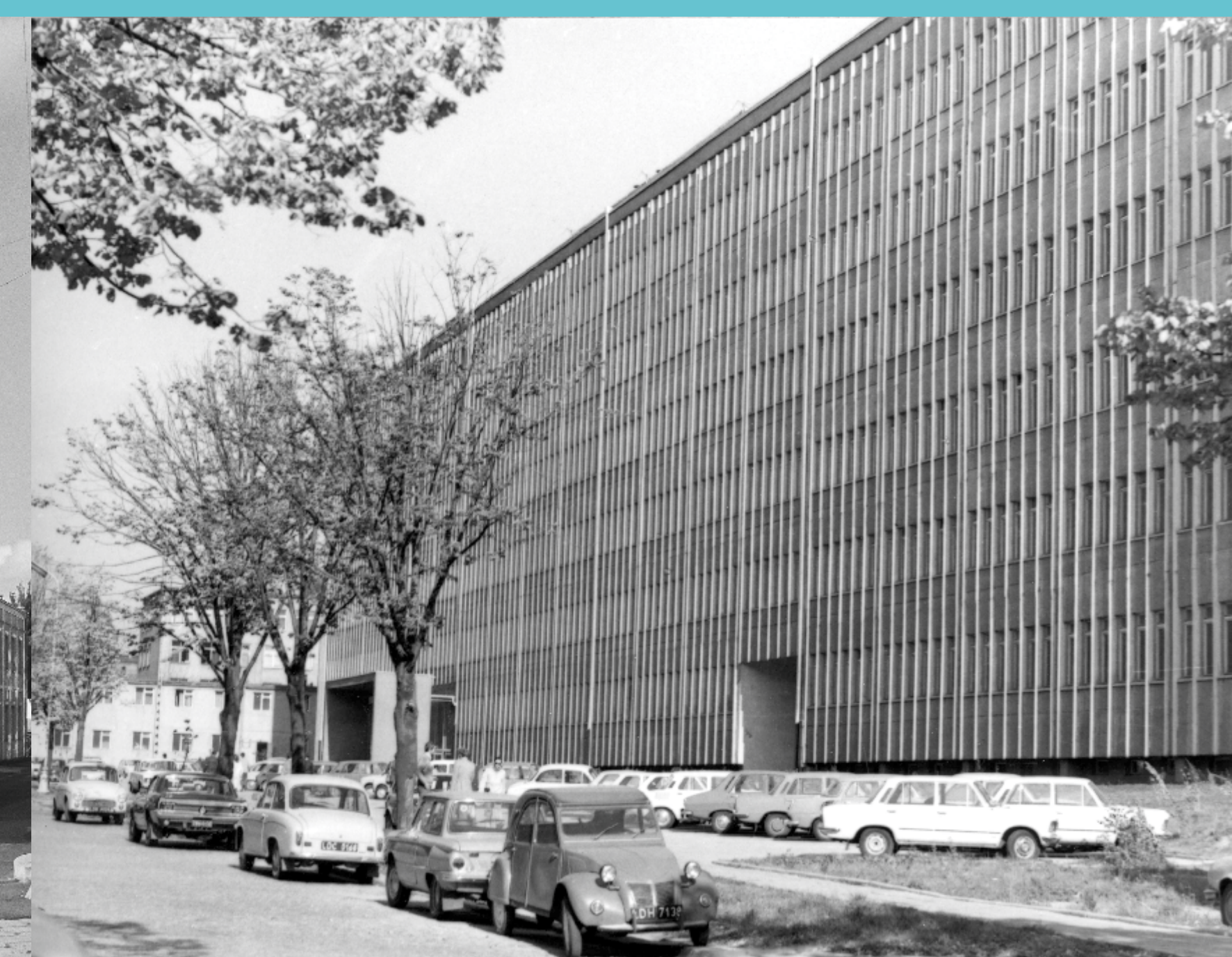
Budynek Wydziału Chemii Spożywczej, obecnie Biotechnologii i Nauk o Żywności