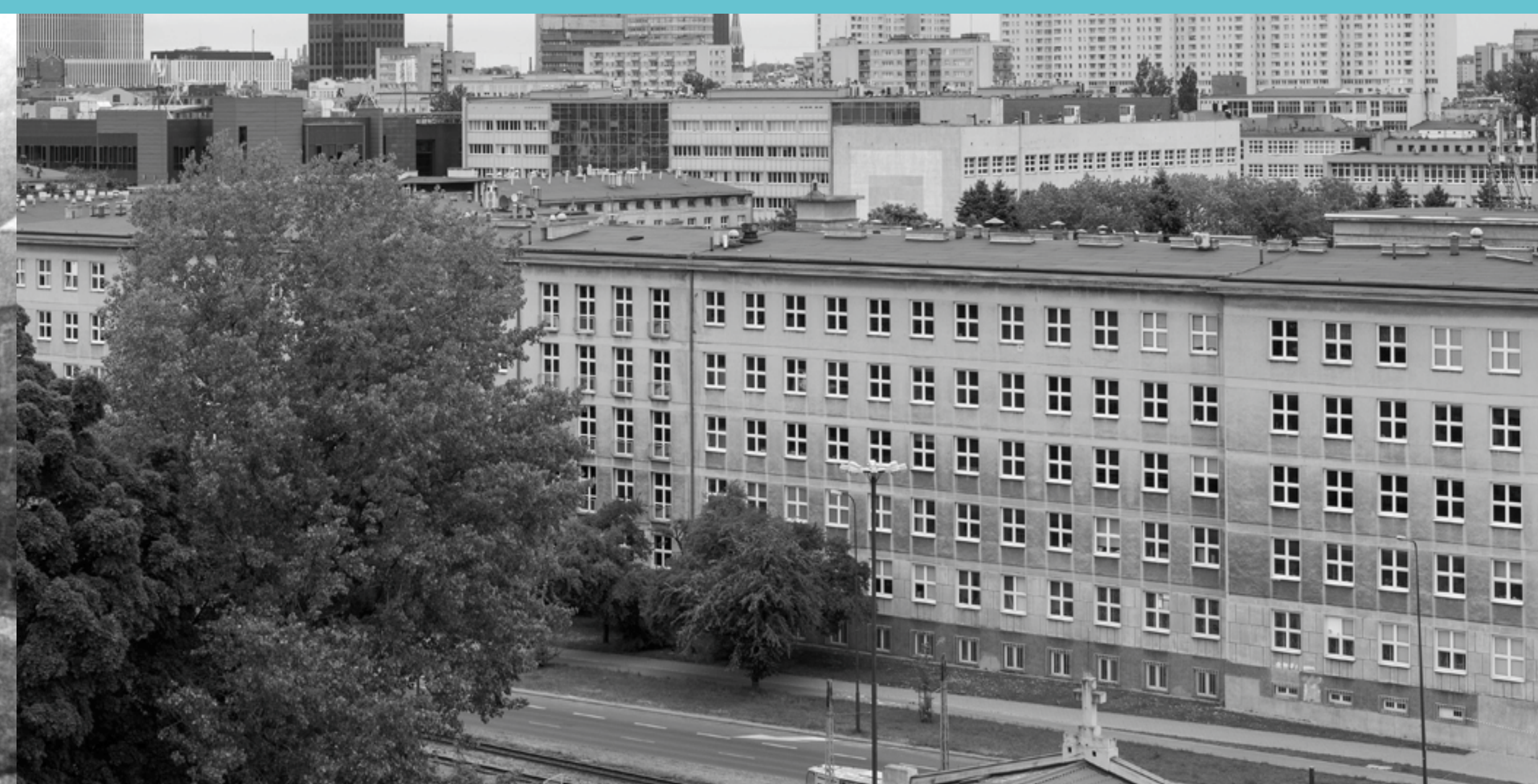
Widok na budynek Wydziału Włókienniczego, obecnie Technologii Materiałowych i Wzornictwa Tekstyliów