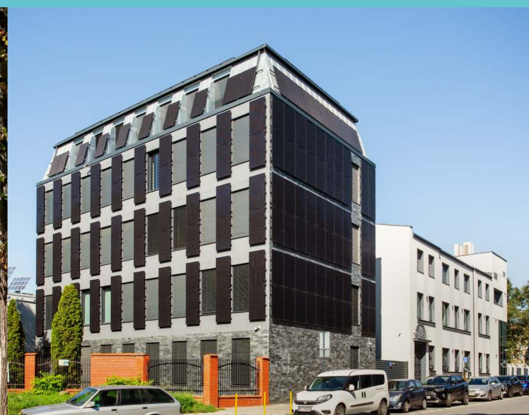
Kampus Politechniki Łódzkiej, część północna. Widok od ulicy Wólczańskiej, 2023 rok