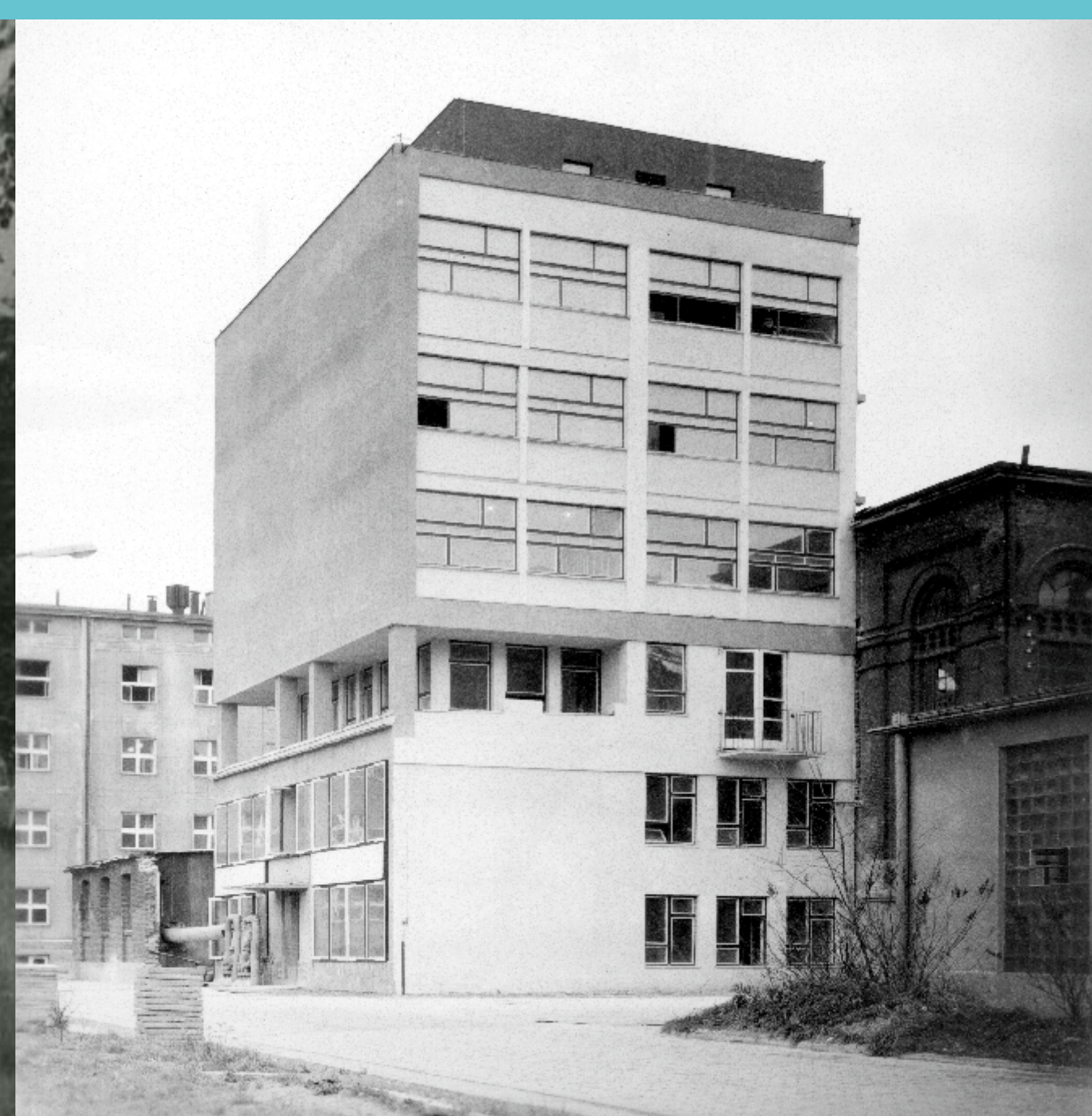
Budynek Wydziału Mechanicznego. Lata 80. XX wieku