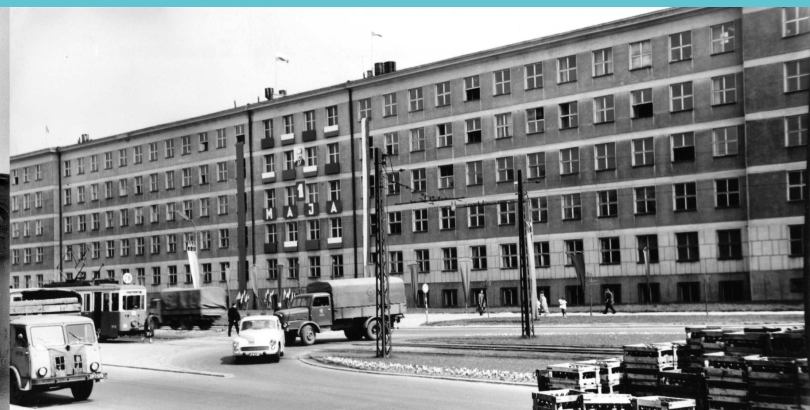
Budynek Wydziału Włókienniczego, obecnie Technologii Materiałowych i Wzornictwa Tekstyliów. Widok od Alei Politechniki