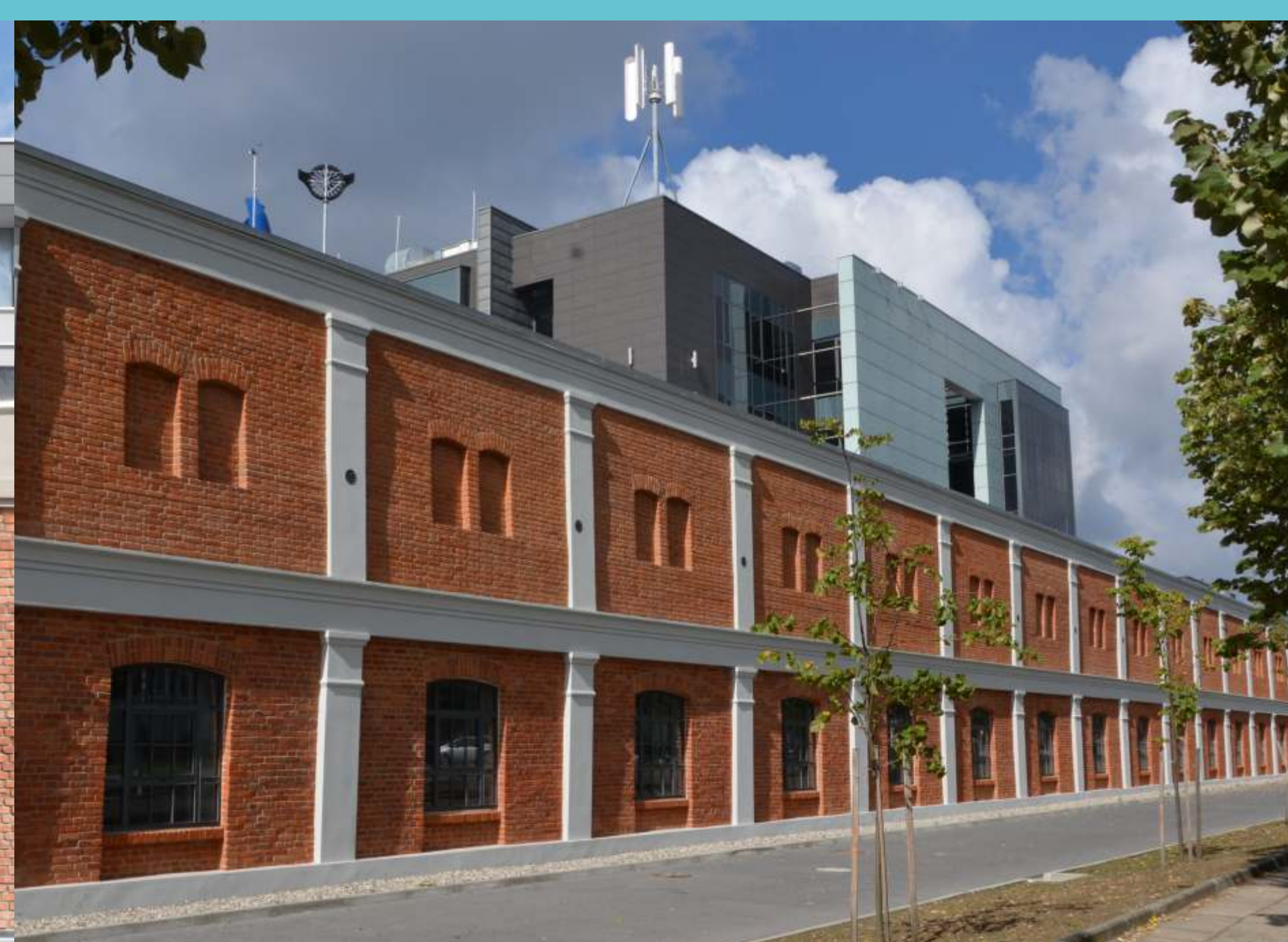
Kampus Politechniki Łódzkiej, część północna. Budynek Wydziału Mechanicznego, widok od strony ulicy Stefanowskiego. Druga dekada XXI wieku