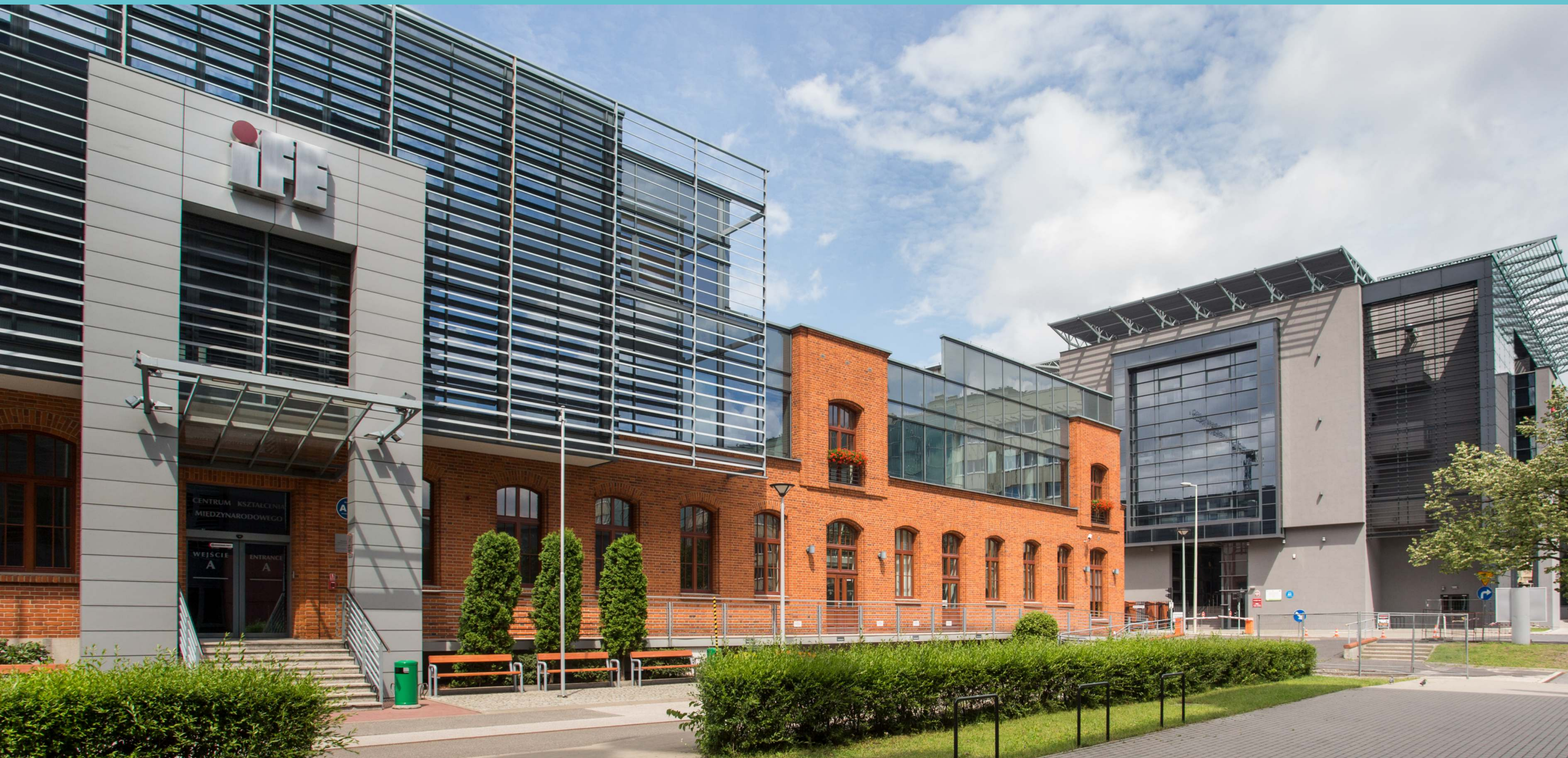
Budynek Centrum Kształcenia Międzynarodowego IFE Politechniki Łódzkiej. W głębi budynek Wydziału Inżynierii Procesowej i Ochrony Środowiska LabFactor , 2020 rok