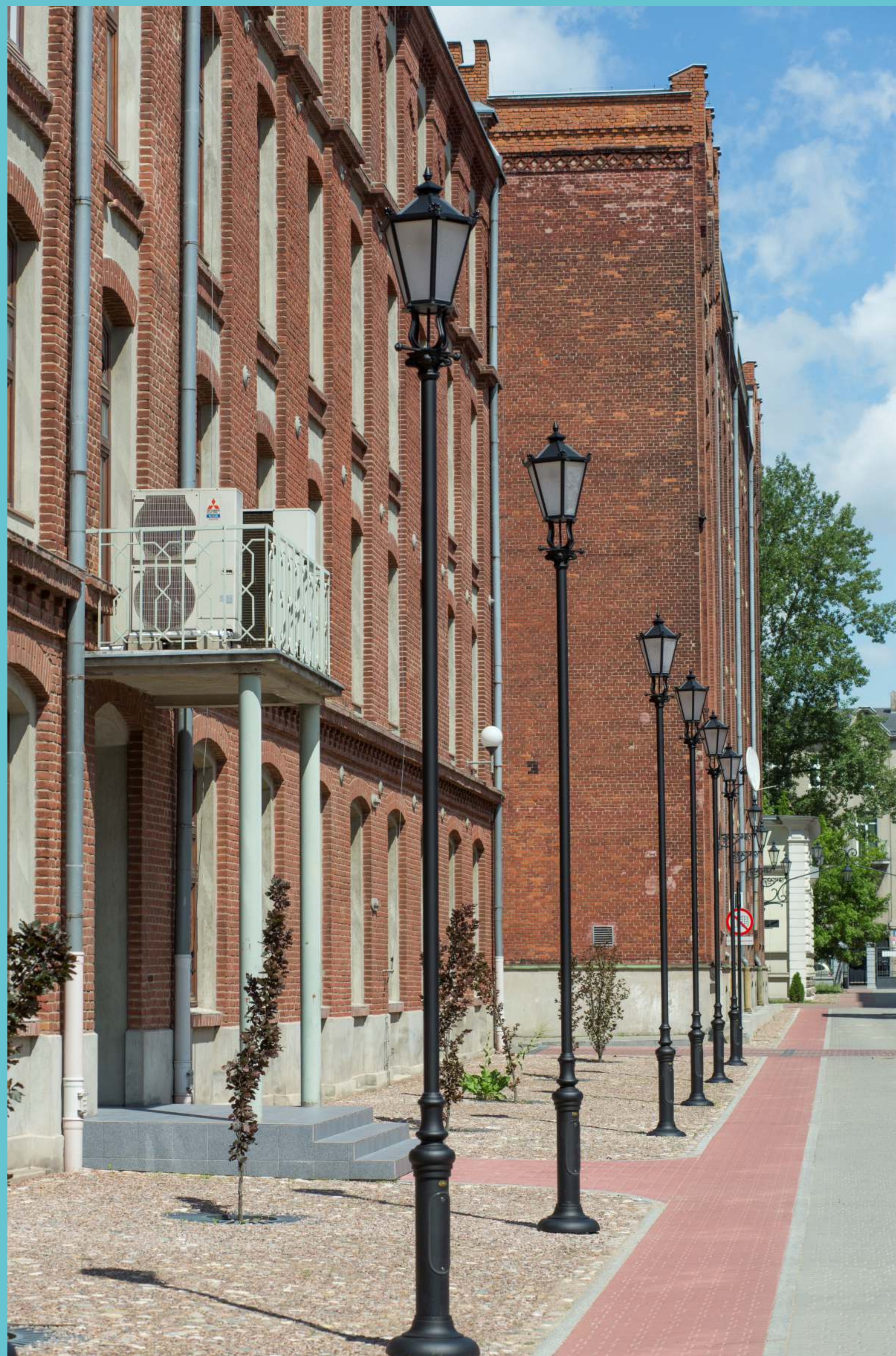
Kampus Politechniki Łódzkiej, część południowa, 2019 rok