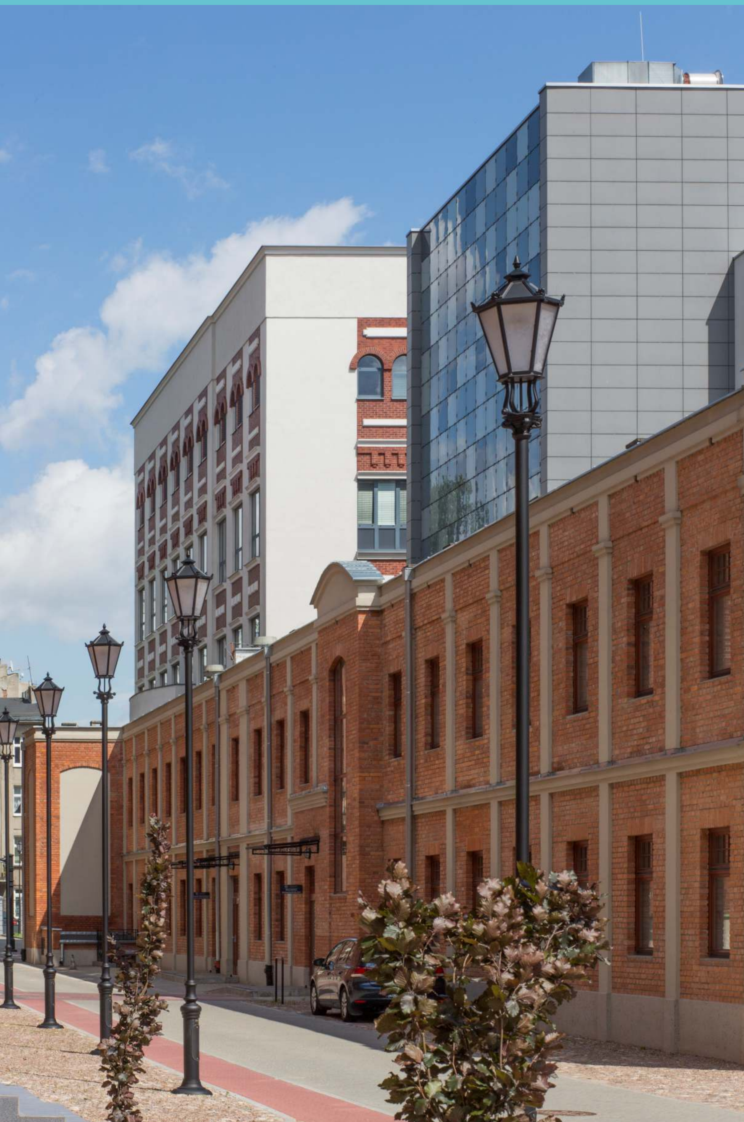
Kampus Politechniki Łódzkiej, część południowa. 2019 rok