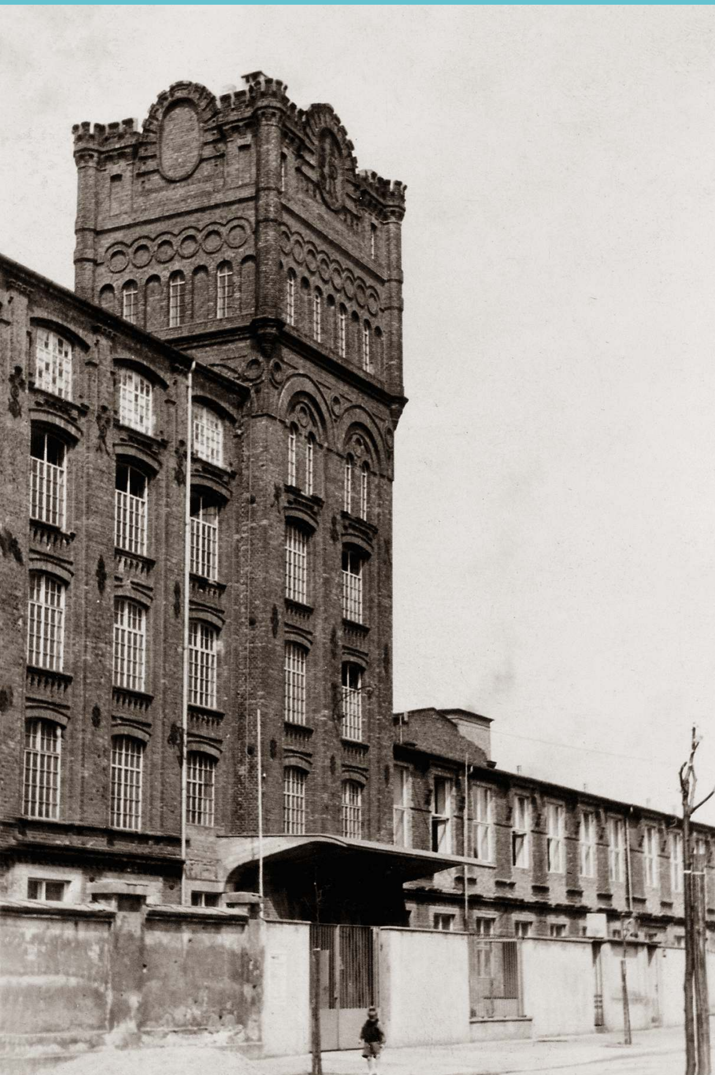
Widok Gmachu Głównego PŁ od ulicy Gdańskiej obecnie ulicy Stefanowskiego