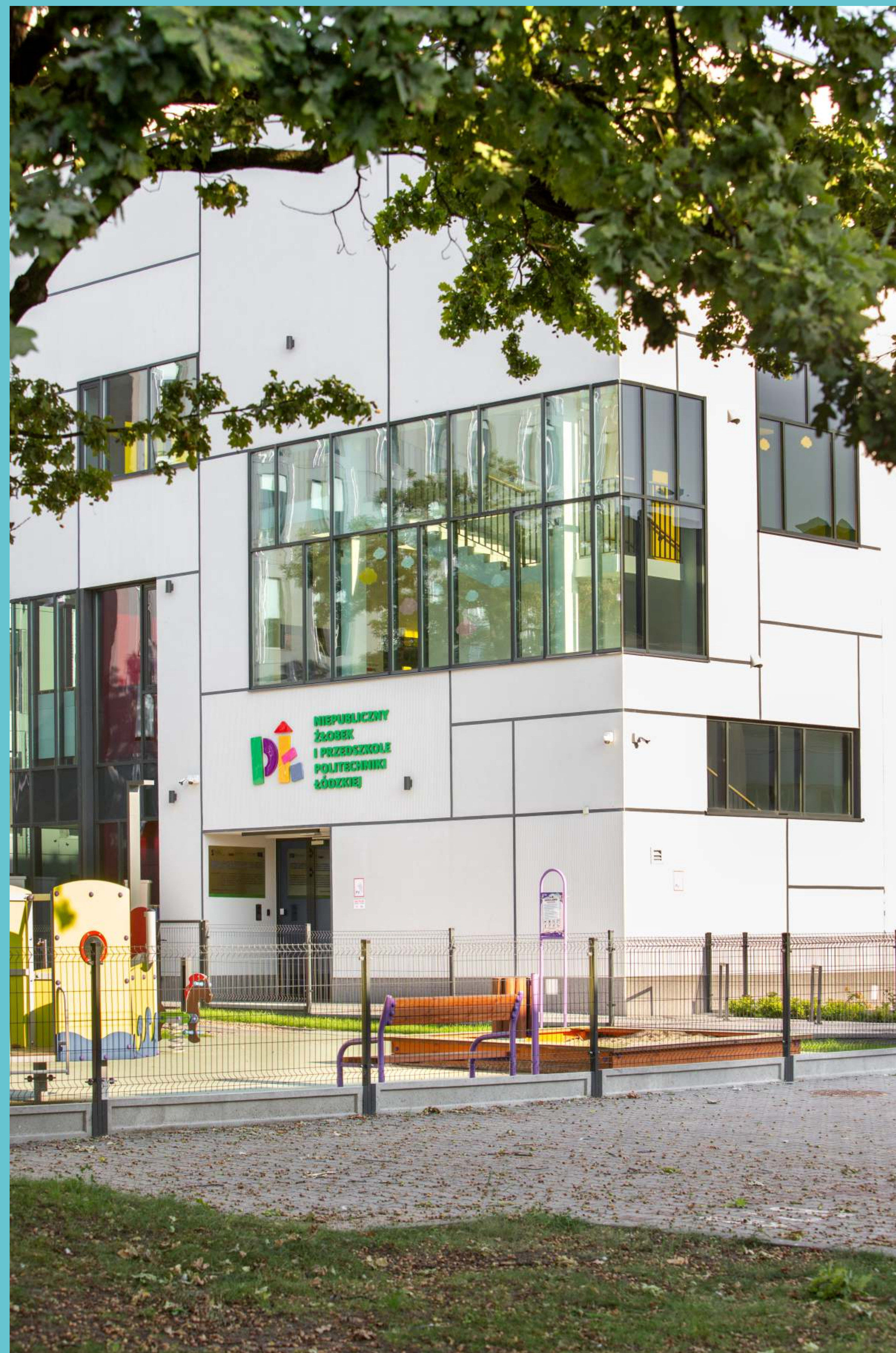
Żłobek i przedszkole Politechniki Łódzkiej, 2023 rok