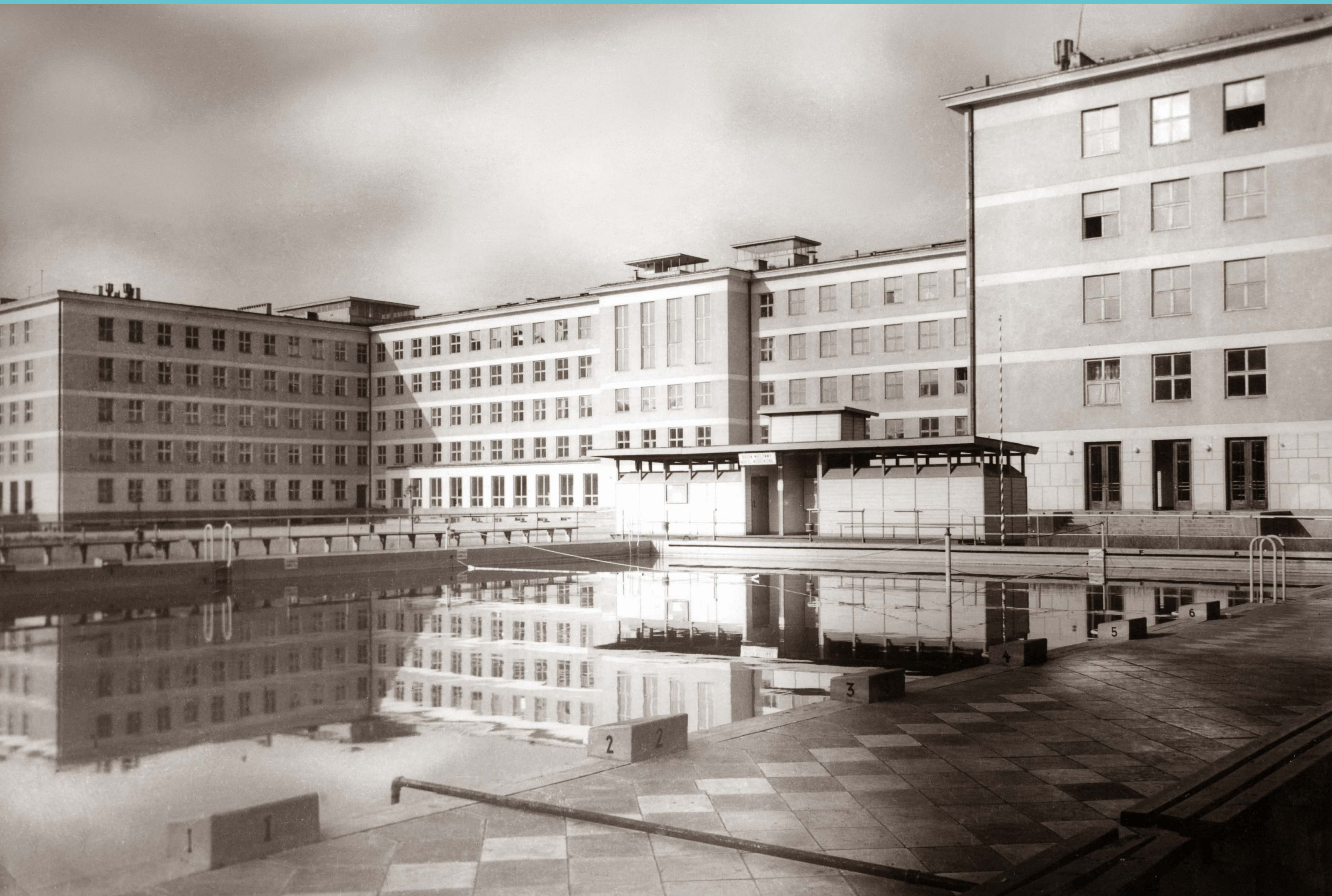
Teren Politechniki Łódzkiej. Budynek Wydziału Włókienniczego, obecnie Wydziału Technologii Materiałowych i Wzornictwa Tekstyliów. Widok od strony dawnego basenu kąpielowego. Lata 60. XX wieku