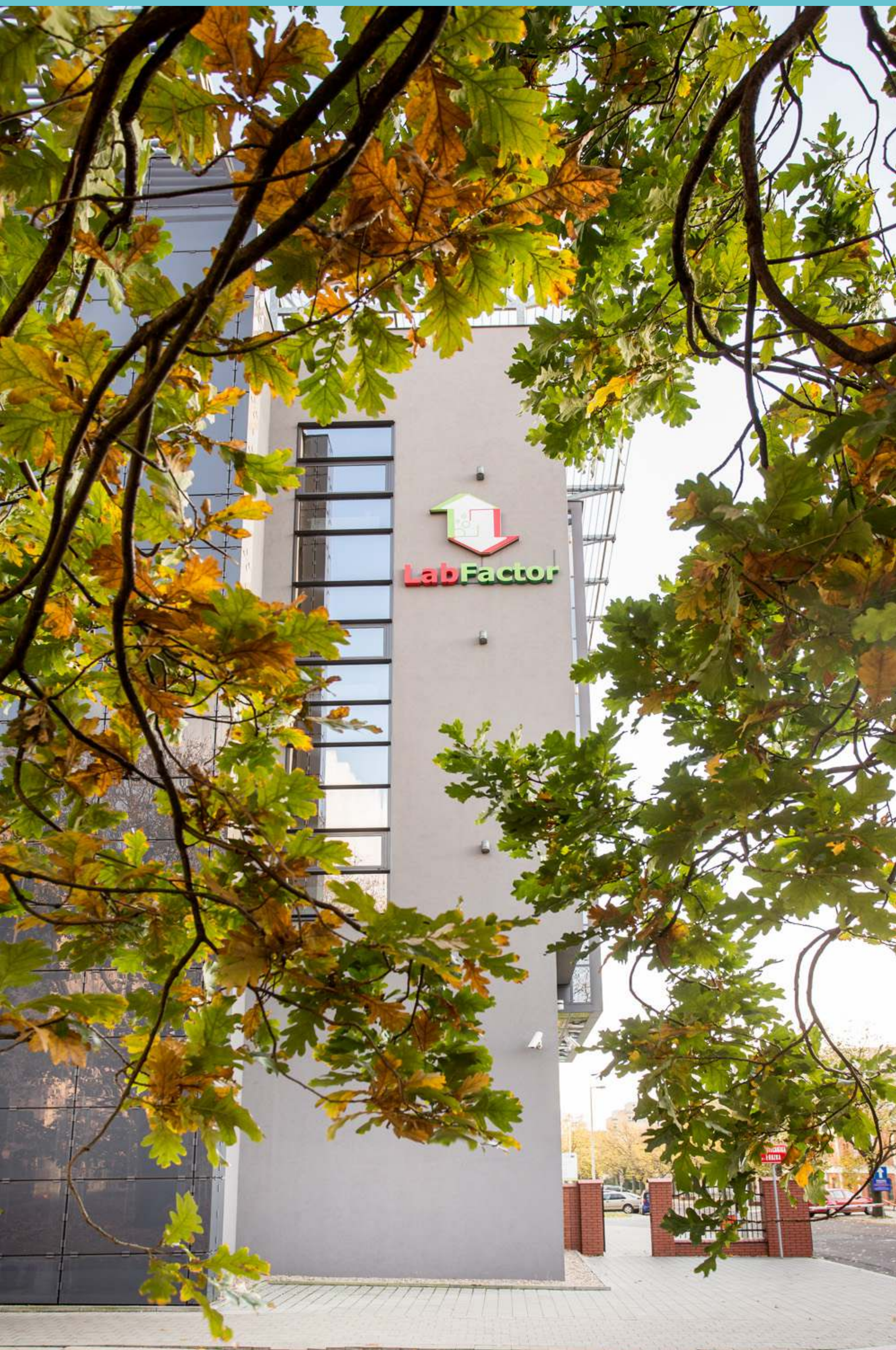
Kampus Politechniki Łódzkiej, część północna