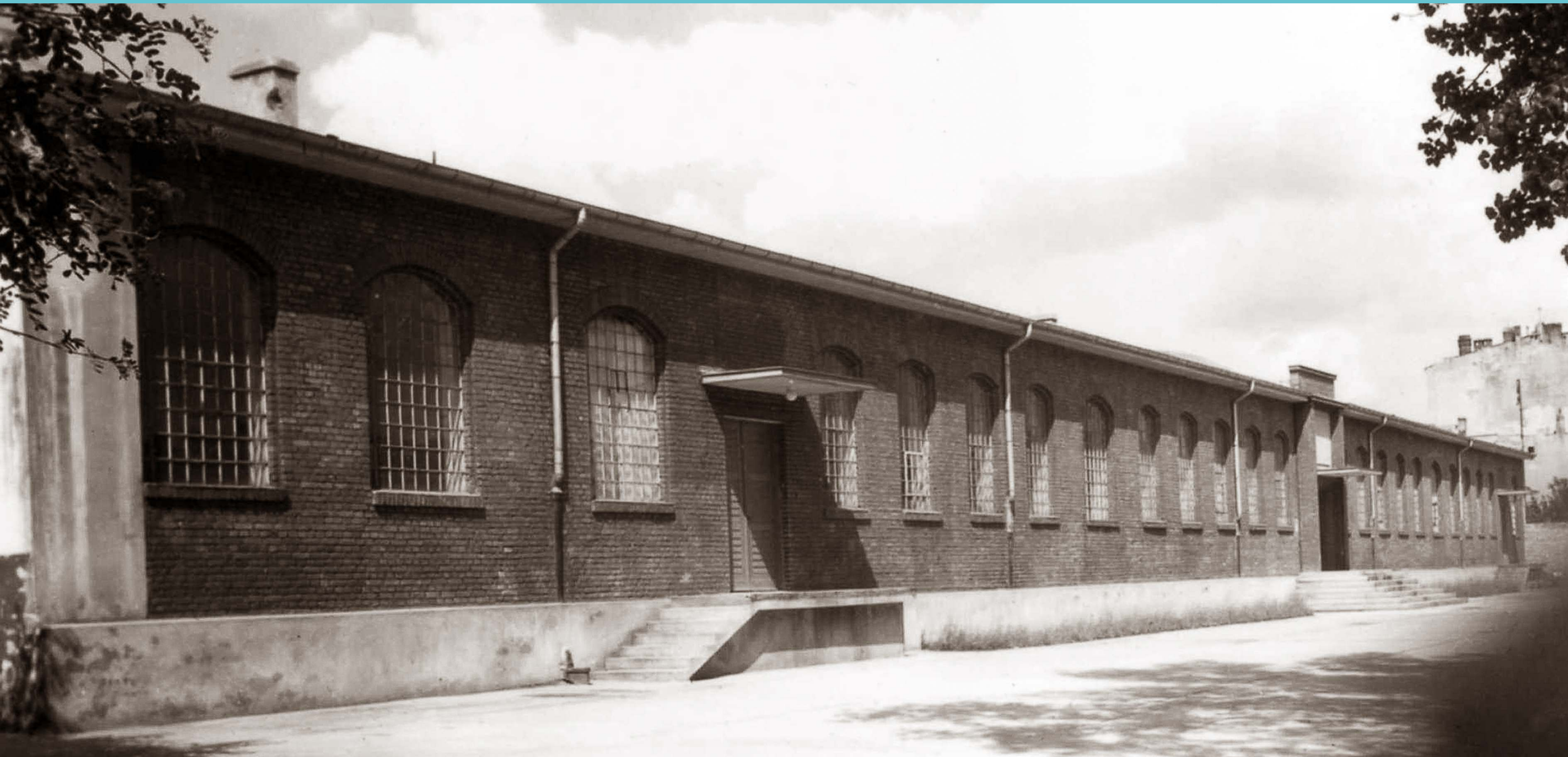
Dawny Pawilon Tkactwa Wydziału Włókienniczego, 1948 rok. Obecnie w miejscu tym znajduje się budynek Centrum Kształcenia Międzynarodowego IFE Politechniki Łódzkiej