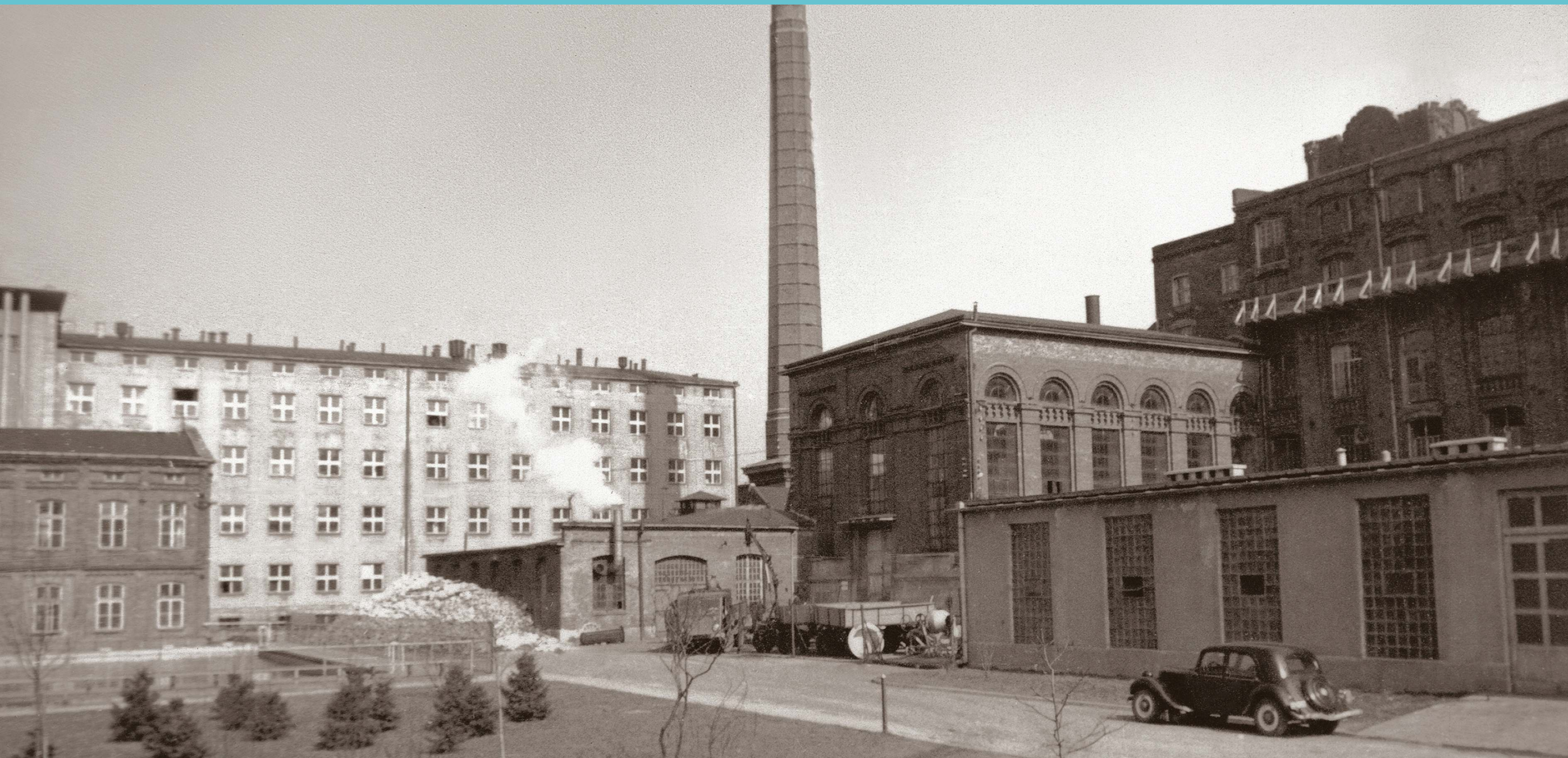
Teren Politechniki Łódzkiej. Widok od strony dziedzińca. Lata 50. XX wieku