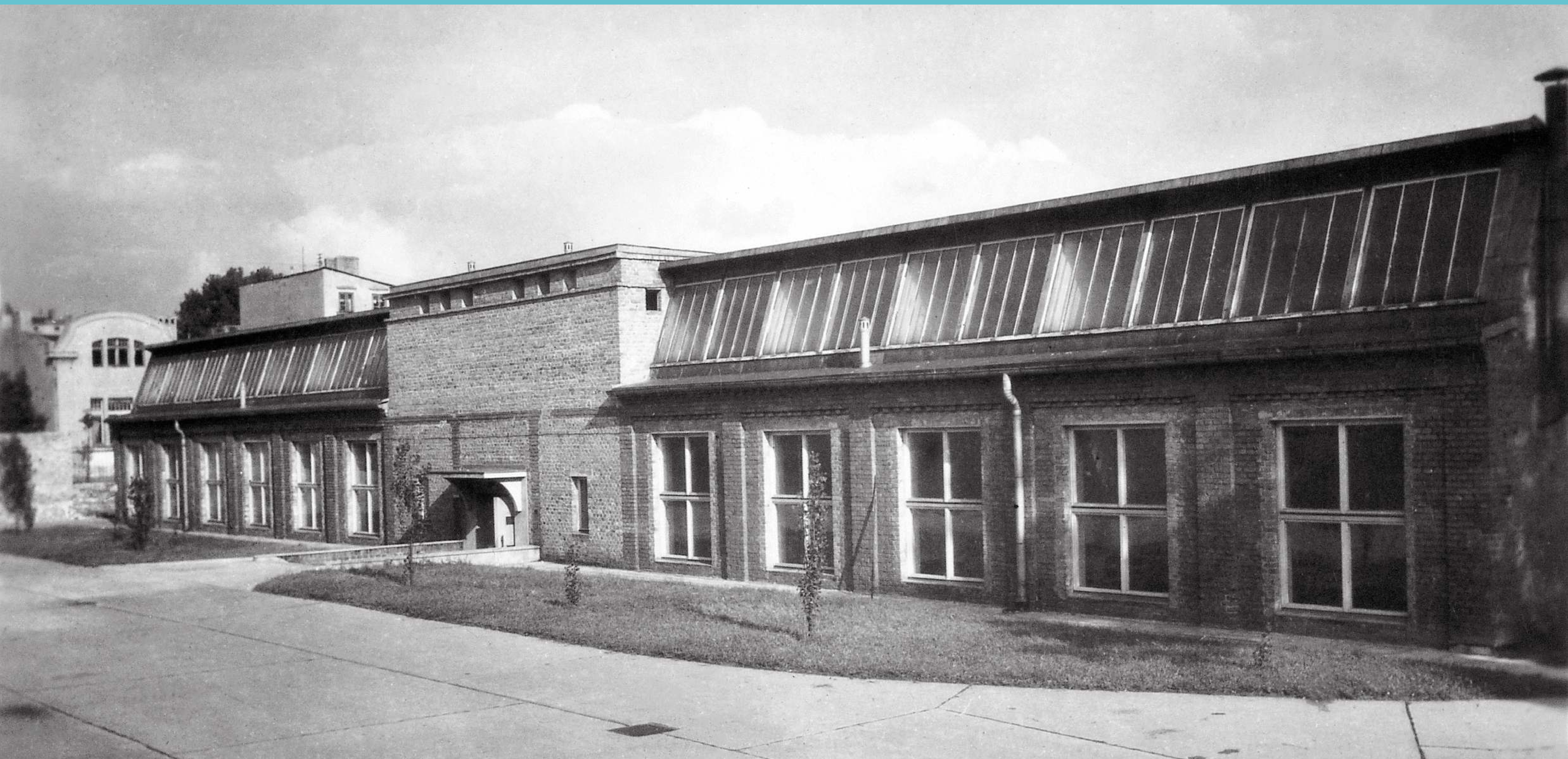
Teren Politechniki Łódzkiej, widok na budynek szedowy Wydziału Mechanicznego. Był to jeden z pierwszych budynków przejętych przez Politechnikę już w 1945 roku. Budynek został rozebrany w 2010 roku. Lata 50. XX wieku