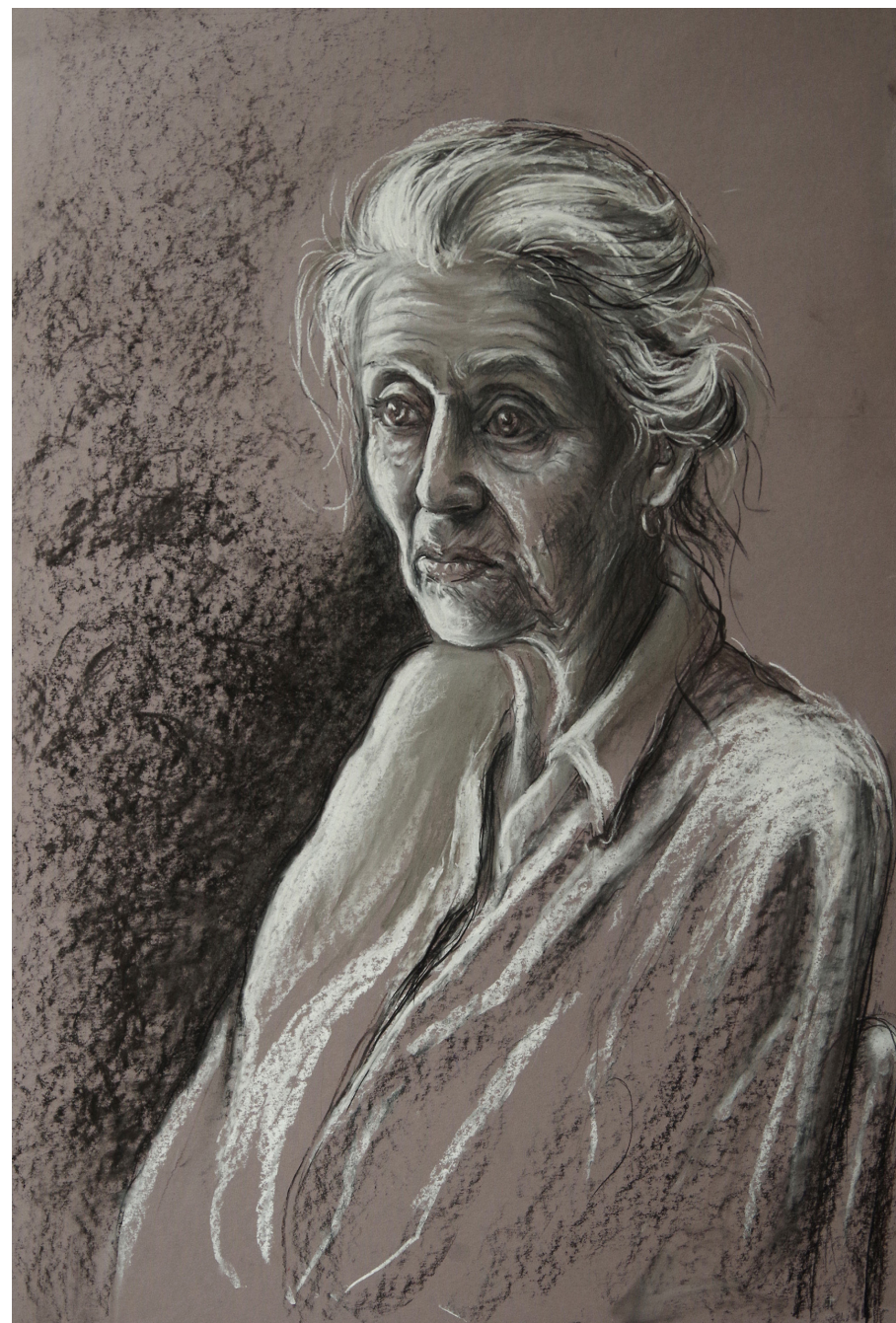
Seniorka, 2024, węgiel - biała kredka, 70x50